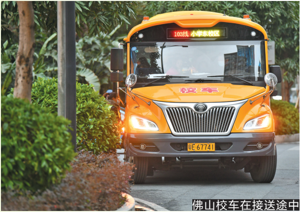
佛山校车在接送途中

《办法》对校车司机以及随车照管人员有严格规定。其中,机动车驾驶人申请校车驾驶资格的,除需要身份证明、驾驶证、体检证明外,还需要户籍所在地县级以上公安机关出具的无犯罪、吸毒行为记录证明。此外,学校或者校车服务提供者提供