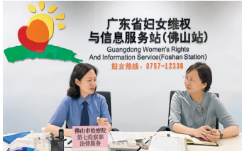
检察官走进妇联维权站

“以12338热线为载体,把‘检护明天’党建品牌建设有机融合到一线服务群众的窗口,是践行‘我为群众办实事’的生动实践。”该院第七检察部相关负责人介绍,通过与妇联“党建+未检”共建的模式,拓展加强未成年人司法保护、落实侵害未成年人强制报告制度、发现涉未成年人公益诉讼线索、