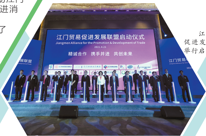
江门贸易促进发展联盟举行启动仪式

活动现场还举行了2021江门市重大商业项目开业(动工)仪式,2021乐购江门夏季消费节活动启动仪式以及江门市商业协会第一届理事会授牌仪式。