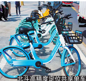
北斗高精度定位共享单车

香洲区现有的共享单车,一是搭载了高精度的定位芯片,理论定位精度为厘米级;二是采用了分体式车锁,锁车、还车的操作均在手机APP上操作,无法手动机械操作。相较于传统的GPS定位技术以及GPS多模块卫星定位技术,配备北斗高精度定位技术的共享单车定位精准度大幅度提升。据悉,能达到理论测试精度和九洲城试点周边无高楼、树木遮挡以及测试当天天气较好,无积厚雨云等因素相关。