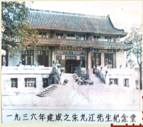
1936年建成的朱九江先生纪念馆

在“点亮教育”的指引下，如今的九江中学不断朝着有深厚文化底蕴、优美校园环境、优秀教学质量、面向未来的现代化领航名校前进。在今年3月28日举行的该校2021年成人礼上，1003名学生的父母亲自为孩子“点亮”未来——成年的学生们不仅要按照传统礼仪，由父母给孩子戴上成人帽，让学生与父母交换家书，更让父母将一本《宪法》交到子女手中，要求子女维护宪法权威，忠于祖国和人民。“敦行孝悌、崇尚名节、变化气质、检摄威仪”，这个由朱次琦在百余年前提出的治学思想，至今仍深深种在每一位九江中学的学子心中。