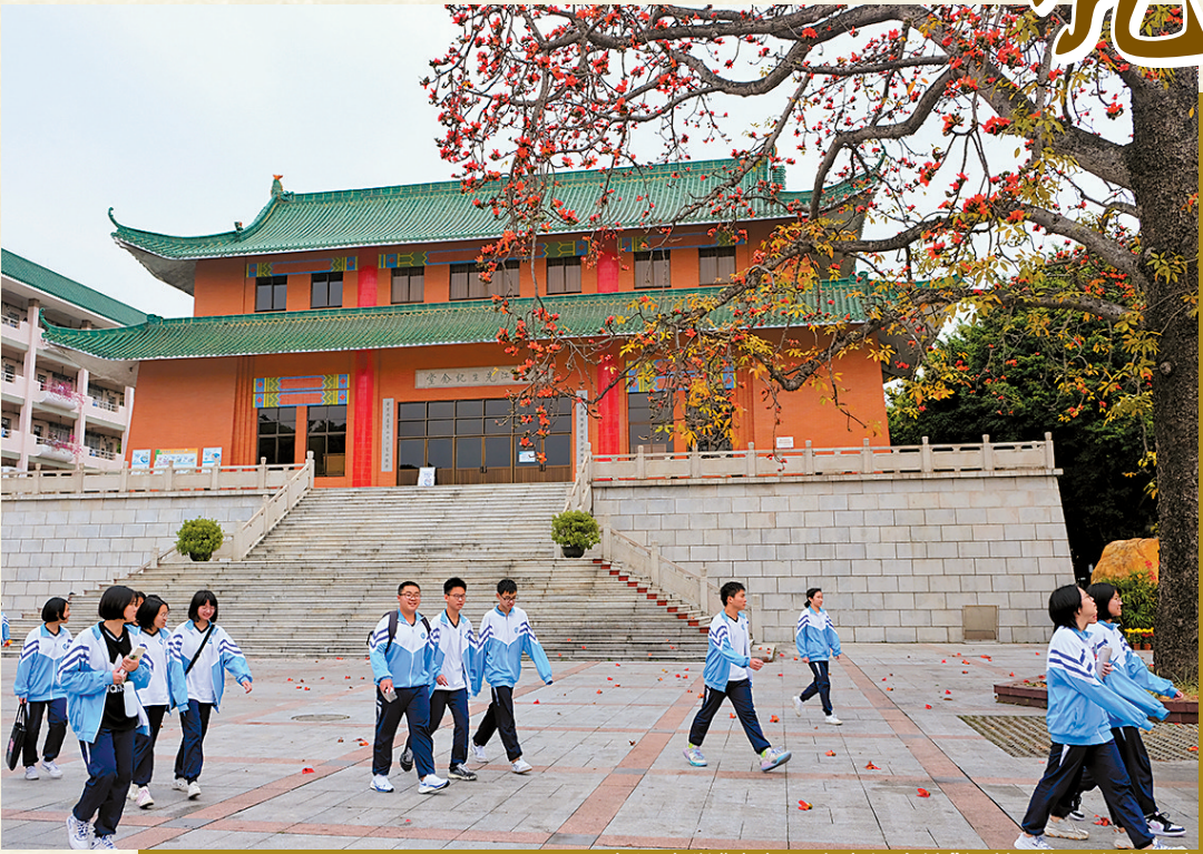
九江中学“朱九江先生纪念馆”门前，学子纷纷经过