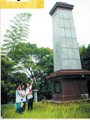
▼九江中学校内朱九江纪念碑