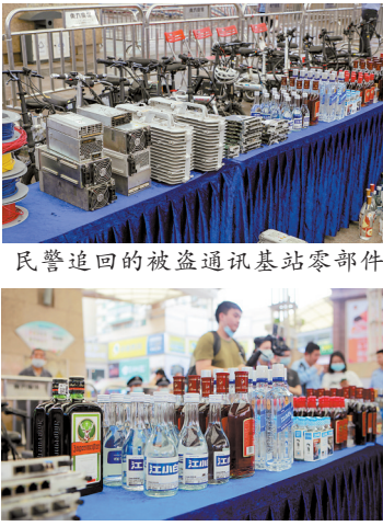
民警追回的被盗通讯基站零部件

民警发现，嫌疑人通常驾驶一辆粤S牌小车作案，该车行迹轨迹覆盖了佛山禅城区、高明区、顺德区等区域，并且专门停在商场的停车场，并通过穿宽大衣物、将酒品塞入衣服中来掩人耳目。3月26日，嫌疑人驾驶作案车辆又出现在了江门市蓬江区某商场停车场，疑似在该商场进行盗窃。