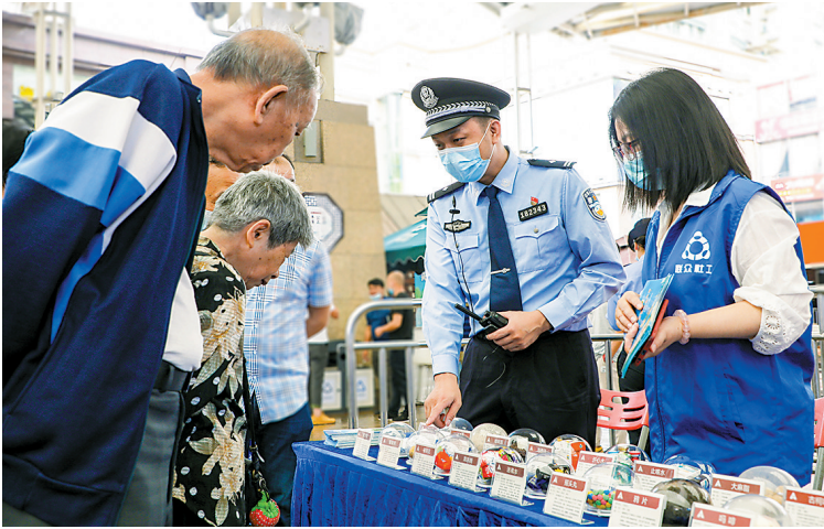
失主前来领取被盗财物

据悉，今年第一季度，佛山禅城公安紧密结合队伍教育整顿工作，深入开展“我为群众办实事”实践活动，全心全意为群众破案挽损，共计侦破民生“小案”370多宗，让234名群众的被盗财物失而复得。