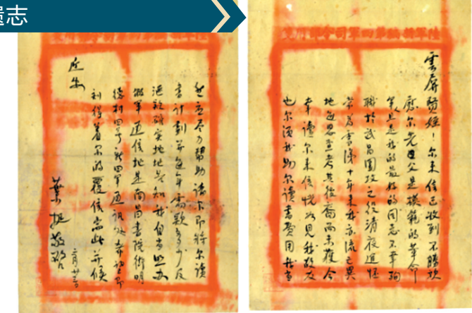
叶挺给曹渊烈士之子的信

叶挺在信中说：“尔来信已收到，不胜欣慰。尔父是模范的革命军人，且是我的最好的同志，不幸殉职于武昌围攻之役。清夜追怀，常为雪涕。十年来我亦流亡异地，每思查考其后裔而未获。今幸读尔来信，恍如见