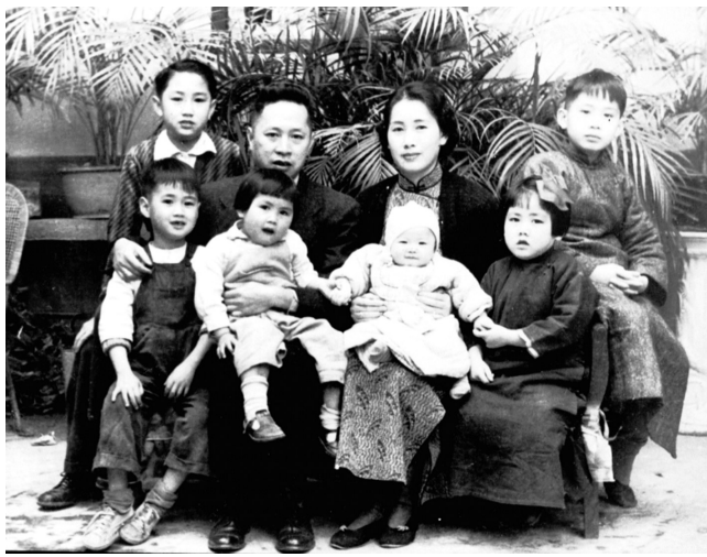
叶挺与家人的合照

在广东国民政府革命军举行讨伐军阀陈炯明的第一次东征时，叶辅平在淡水积极做策应工作，秘密发动工农群众配合支持东征军。同年秋，