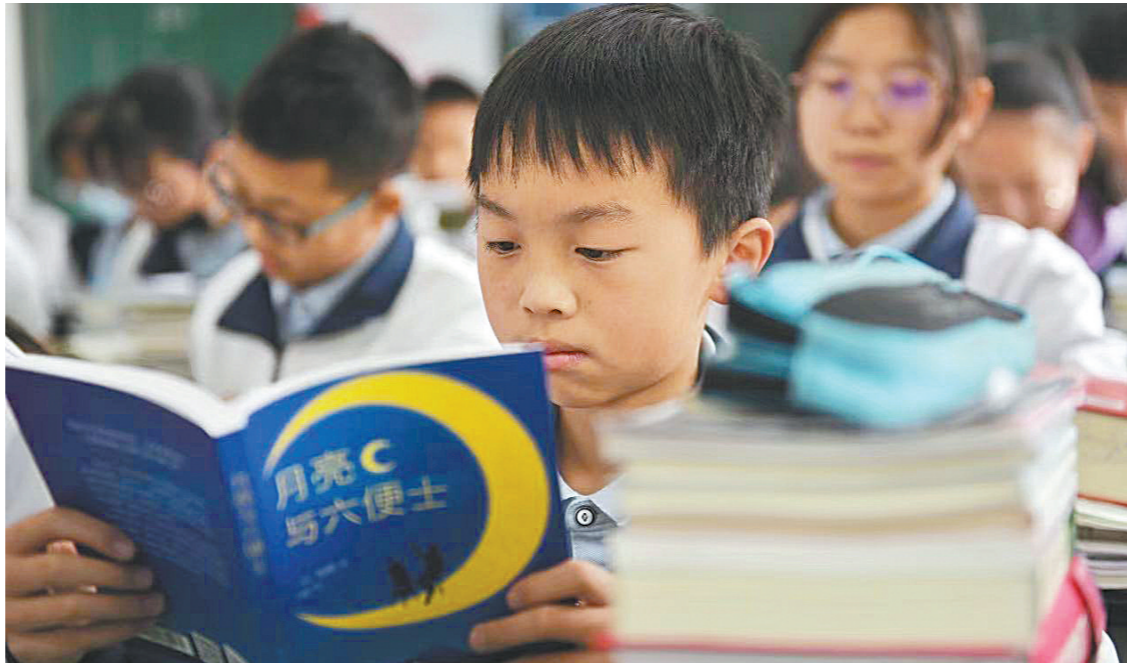
凉山州民族中学学生正在翻阅获赠图书

数据显示，去年有超过4亿人次通过拼多多“拼知识”，“拼”回家的知识相当于11个国家图书馆的藏书。今年多多读书月期间，拼多多更是投入5000万元“读书基金”助力知识普惠，无论是高知人群、都市白领，还是小镇青年、偏远地区的阅读人群，都能够把低价正版好书带回家。