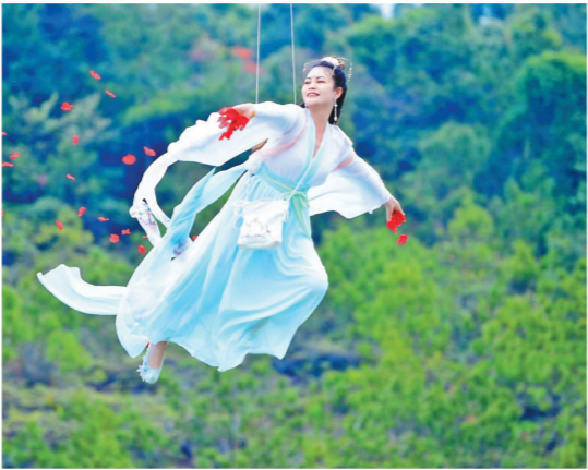
观音山网红项目威亚飞天

种植为基础,精心打造特色太空果蔬展示、水上水稻试验田、无土栽培大棚农业生产示范项目,有机融合呈现了二十四节气农事知识、农耕文化体验、旧农具体验、新型农业栽培技术推广等科普教育主题。市民游客既可系统地认识古今农业发展历程,可以亲身参与农事活动,还可亲手采摘品尝美味的特色有机果蔬。