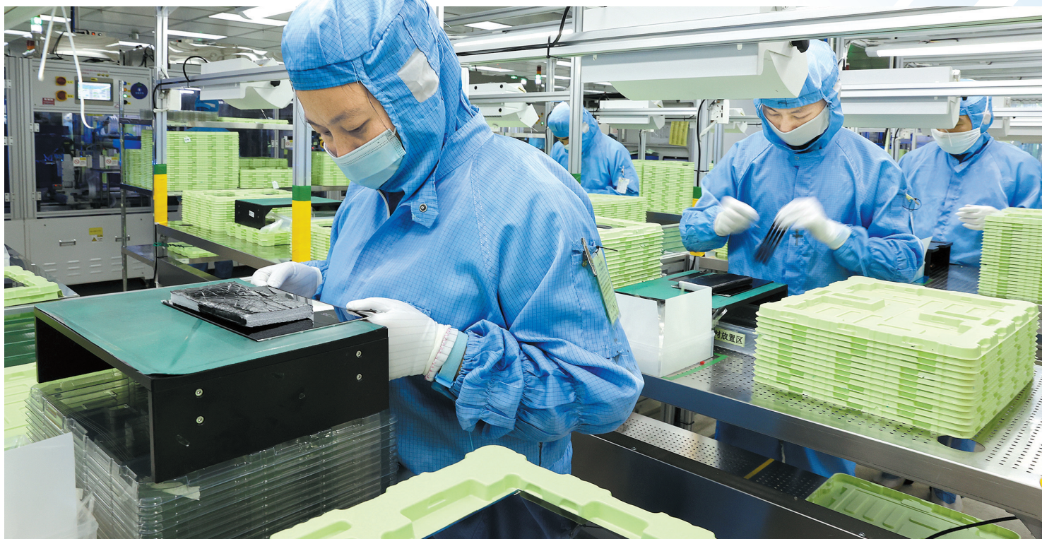
打造多元发展的现代化产业新体系

无论是企业，还是科创园区，以制造业立市的东莞，近年来产业不断转型升级，在高质量发展进程中进步明显。今年东莞市政府“一号文”提出，要以激发激活活产业、企业、科技、投资、市场和平台新动能为主线，全力打造多元发展、多极支撑的现代化产业新体系。到2023年年底，高技术制造业增加值占规模以上工业增加值比重达到40%以上；到2025年年底，形成万亿级的新一代信息技术、五千亿级的高端装备制造，千亿级的新材料、新能源、服装鞋帽、食品饮料，百亿级的镇街特色产业集群等“万、千、百”亿级梯队发展格局。