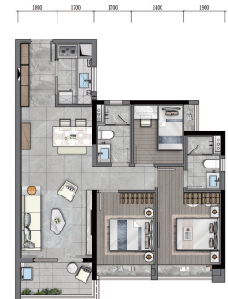
98m 2 舒适三房