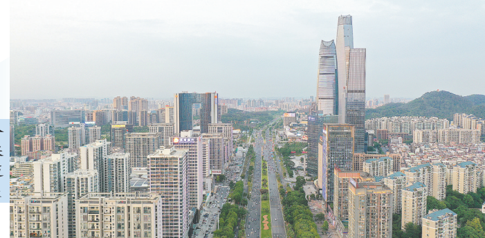
东莞今年全力确保GDP稳步迈过万亿元大关

质量持续向好，市容颜值持续改善，美丽东莞持续升级，城市面貌、城市功能和城市形象大幅提升，人民群众的幸福感、获得感、自豪感明显增强。