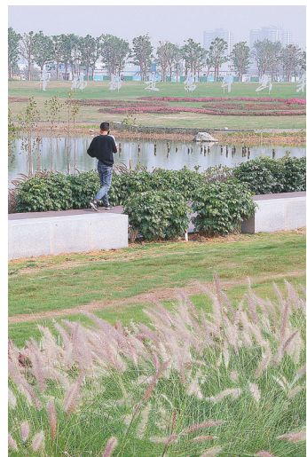
滨海湾新区成为东莞形象展示新窗口