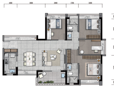
117m 2 全能四房