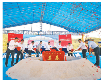
京东智谷二期开工典礼暨首批企业签约仪式

今年,凤岗镇将继续抓好重大项目建设,进一步健全党政领导班子“一对一”服务跟踪、多部门联动、督查考核保障等机制,及时协调解决项目建设中遇到的各类问题。加快推进京东湾区总部、都市丽人智能产业项目二期等市重大预备项目前期工作,确保康佳、深证通二期、天安深创谷等项目如期实现投产投用目标。落实对理光、天安数码城一期二、三组团等项目的跟踪服务工作,促进其尽快完成产值税收预期目标。