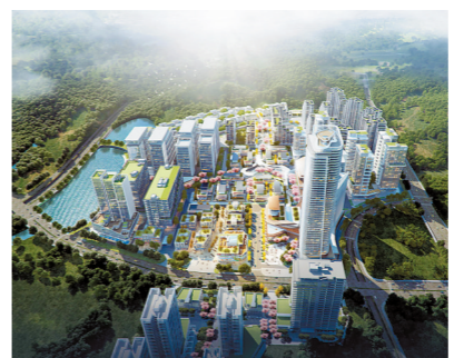
京东智谷项目鸟瞰效果图