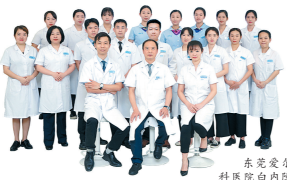
东莞爱尔眼科医院白内障专科不断壮大

作为东莞市医保定点单位，暨南大学附属东莞爱尔眼科医院以精细化管理为抓手、以患者为中心，集临床医疗、防盲慈善、学术交流于一体，迈上了高质量发展的现代化眼科专科医院的“腾飞”之路，特别是在全市白内障复明手术、精准屈光性白内障手术方面发挥了重要作用，基本实现了当地市民眼疾大病不出市的愿望。