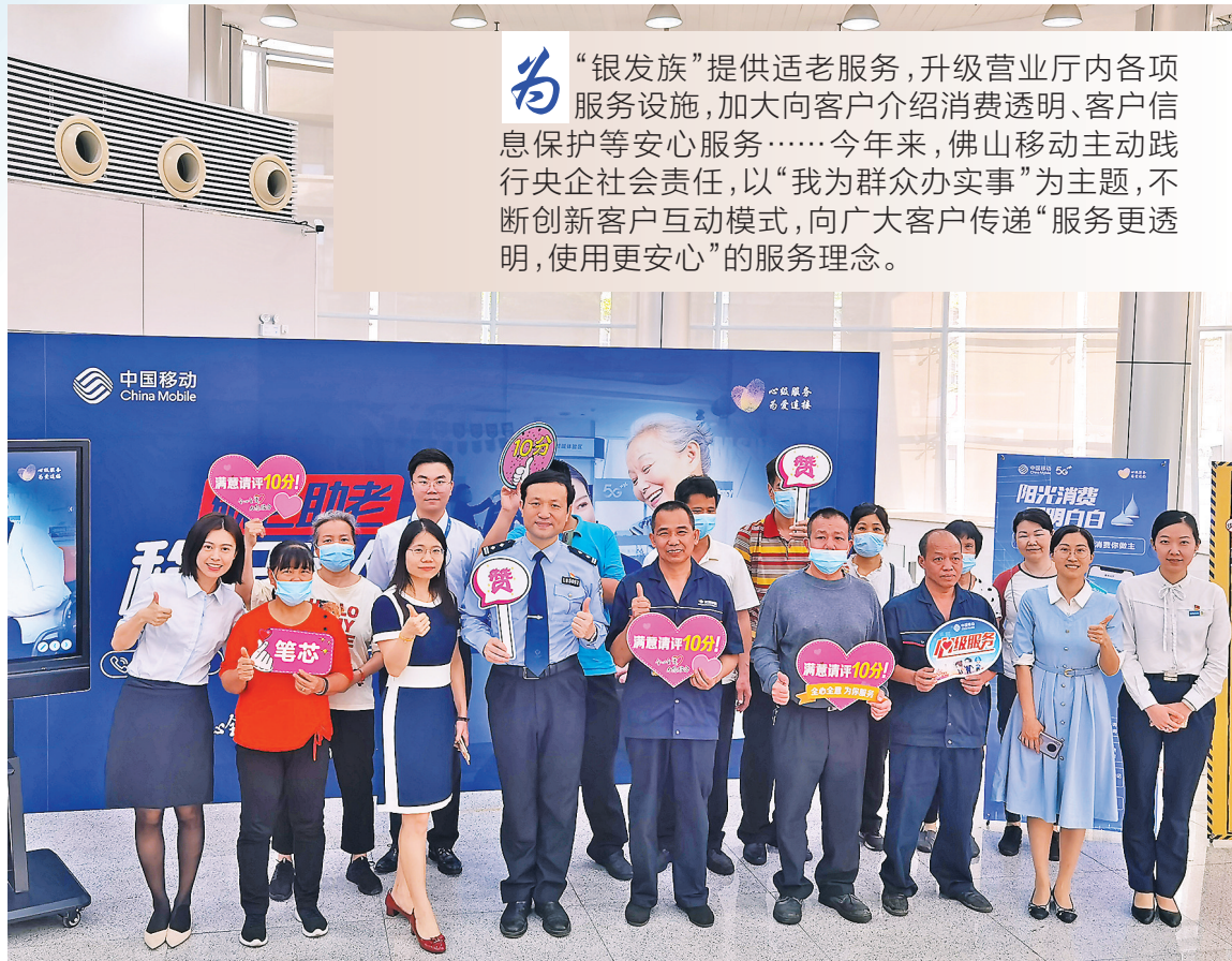
佛山移动举办“银发关爱小学堂”活动

“银发族”提供适老服务，升级营业厅内各项服务设施，加大向客户介绍消费透明、客户信息保护等安心服务……今年以来，佛山移动主动践行央企社会责任，以“我为群众办实事”为主题，不断创新客户互动模式，向广大客户传递“服务更透明，使用更安心”的服务理念。