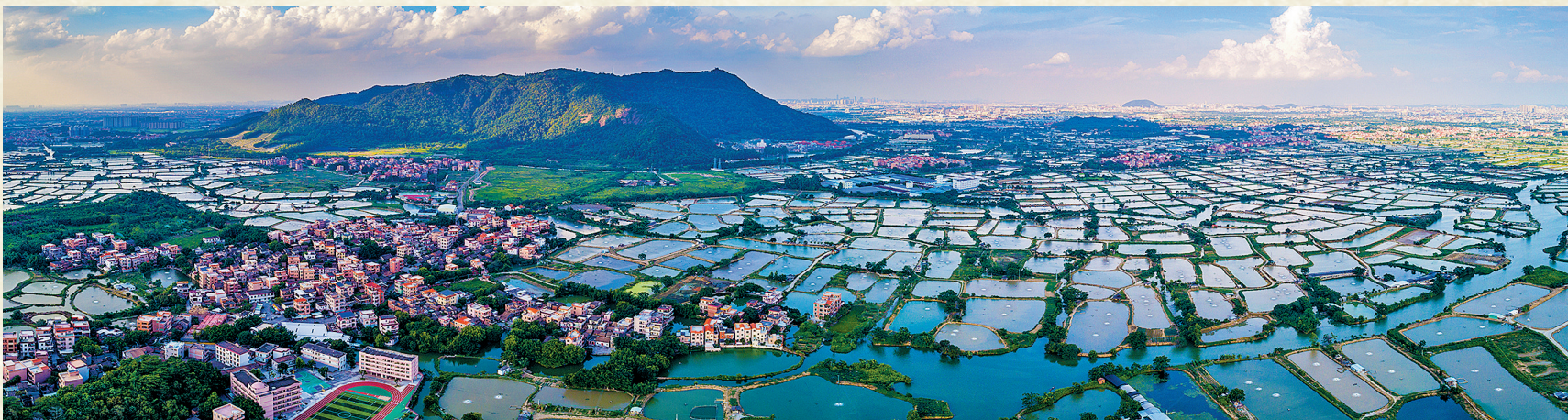
桑园围内桑基鱼塘遍布，图为西樵山南麓的桑基鱼塘