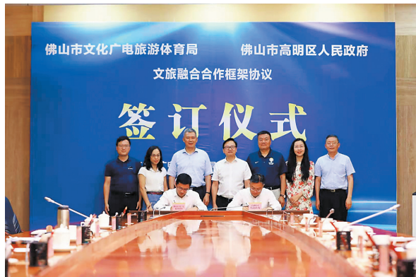
佛山市文广旅体局与高明区政府签约，为高明旅游赋能

据了解，下一步，佛山市文广旅体局将与高明区政府围绕合作协议内容，组织落实议定事项，建立议事机制，推动市区两级文旅融合项目深度融合，努力为佛山打造高质量发展的文旅融合示范城市提供样板路径。