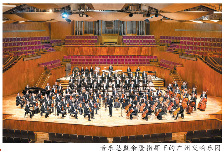
音乐总监余隆指挥下的广州交响乐团