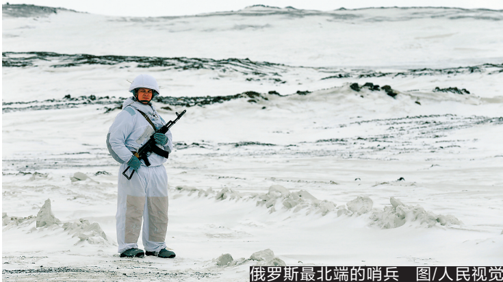
俄罗斯最北端的哨兵

2018年,美国海军向挪威部署一艘航空母舰,这是上世纪80年代以来首次向该地区部署航母。今年2月,美方又派出战略轰炸机到挪威受训,希望加强