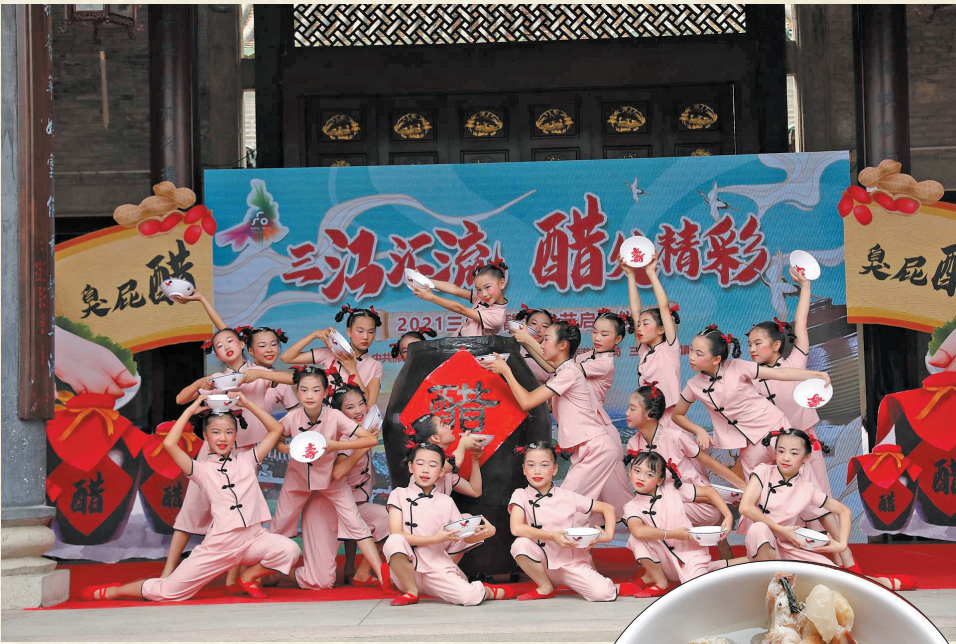
▲根据臭屁醋历史文化创作的表演 ►臭屁醋融入新食材

只是如今居住环境优化，邻舍这样的互动不易再现，臭屁醋更是绝少人自己制作并在家烹煮了。三水城乡的醋餐馆却遍地开花——既然周围都