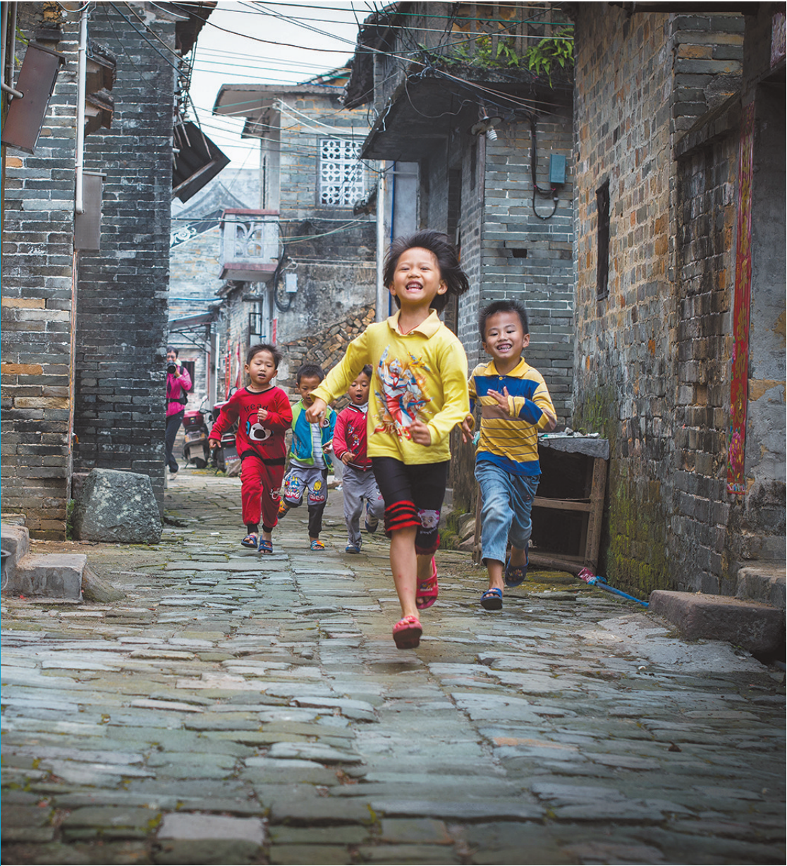
功武村生活闲适 黄克锋 摄