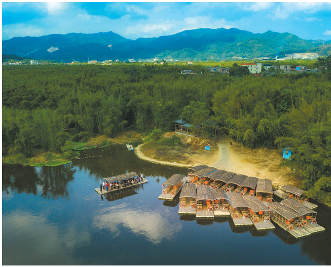
由古码头登上功武村

历经数百年风雨的侵蚀,功武村并未“蒙尘”衰落,反而平添了几分古朴厚重,近年来更是焕发了新活力。据龙华镇党委副书记、镇长钟晓艺介绍,早在2003年,香溪堡旅游区开始投资建设,占地5平方公里,于2004年初正式营业。该旅游区以“香溪河的旖旎景色和淳朴的古堡风情”为主题,以“溪河漂流、古堡探胜、竹林乐园”为项目特色,融自然风光和文化古韵于一体,受到游客追捧。 随着香溪堡旅游区的开发,功武村被越来越多人熟知,古村落的保护受到重视。记者从龙门县文广旅体局获悉,去年10月,功武村古建筑群修缮工程正式启动,项目估算总投资1426万