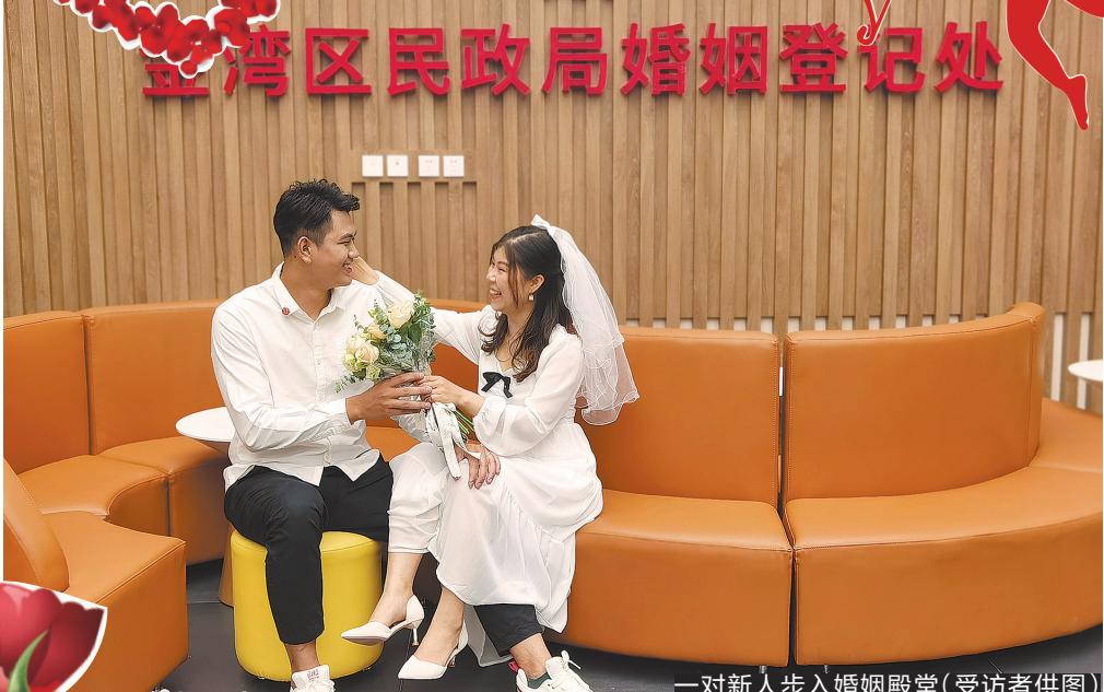
一对新人步入婚姻殿堂(受访者供图)

习教育更“走心”,让爱党爱国情感教育更“入心”。 江门市委常委、市委宣传部部长陈冀在启动仪式上致辞指出,在“520”当天,江门各学校的学生用不同的形式向党和国家“深情表白”,这是一次有意义的“表白”仪式,更是一次由“小我”到“大我”的升华。而在全市组织开展“党史青(少)说”系列活动,就是要用青少年的口吻来讲述中国共产党百年来的英烈事迹和红色经典故事,更好地让青少年知史爱党、知史爱国。 记者了解到,“党史青(少)年说”系列活动包括开展“党史青(少)年说”微演说活动、“小小红色讲解员”讲党史活动、“红色经典诵读”活动、“观影学史”活动、“红色微型剧展演”活动。 记者还了解到,江门还将通过青年学生自编自导自演党史情景剧的形式,生动再现共产党人浴血奋战的革命瞬间,重温共产党人走过的峥嵘岁月。