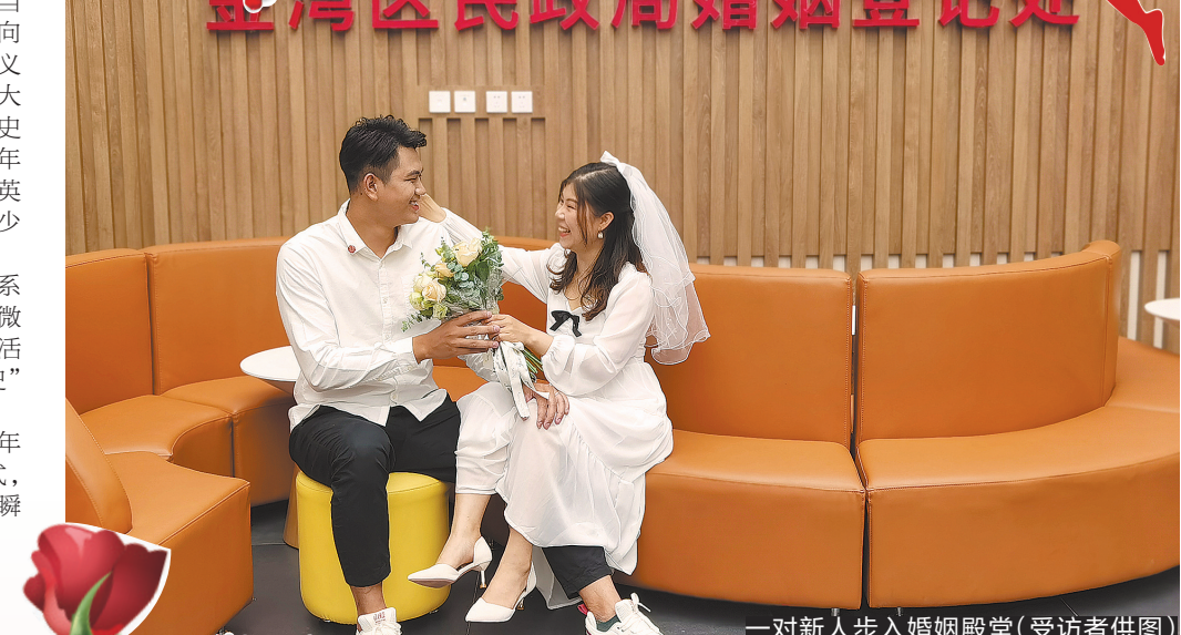
一对新人步入婚姻殿堂

体卡和电子卡,聚焦高层次人才关心的医疗健康、子女教育、配偶就业、社会保障、公共服务等内容,不断健全高层次人才服务保障体系建设,为高层次人才在江门市干事创业提供具有竞争力和吸引力的环境。相关人士表示,通过合作,在科技、产业、人力资源等领域落地一批