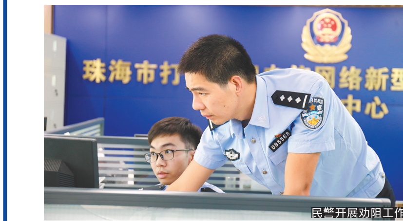
民警开展劝阻工作

羊城晚报讯 记者钱瑜报道:5月20日,由清科创业、投资界主办,华发集团联合主办的第十五届中国基金合伙人峰会在珠海国际会展中心开幕。本次盛会搭建精准高效对接平台,共同探讨LP与GP如何把握市场走向,共话新经济下股权投资之路。 活动吸引了国内知名FOFs、政府引导基金、险资、家族基金、VC/PE机构、上市公司等重磅机构掌舵人出席,嘉宾阵容强大,前海股权投资基金(有限合伙)执行合伙人、前海方舟董事、总裁陈文正,华发集团华实控 股董事长、华金资本董事长、珠海基金董事长郭瑾,平安资本董事长兼首席合伙人刘东,中金资本运营有限公司总裁单俊葆,深圳市创新投资集团有限公司总裁左丁等人齐聚现场,分享真知灼见。 另外,峰会设置了丰富多元的活动环节,包括GP募资路演、LP/GP主题对接会、焦点论坛、LP专场会、LP专题培训五场特色交流活动,力求为LP与GP提供畅所欲言、精准高效的沟通平台。 近年来,在珠海市委市政府的支持下,股权投资行业在珠海发展