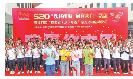
五邑大学学生向党“比心”

羊城晚报讯 记者陈卓栋,通讯员江宣、谭耀广摄影报道:5月20日,江门市举办520“以我初心 向党表白”活动暨“党史青(少)年说”系列活动启动仪式。据悉,江门将围绕“说”“讲”“诵”“观”“演”推出5项活动,让青少年群体从党史学习教育中汲取奋进的力量。 此外,当天五邑大学及江门市中小学校纷纷举办“520·以我初心向党表白”活动,以别开生面的形式让党史学