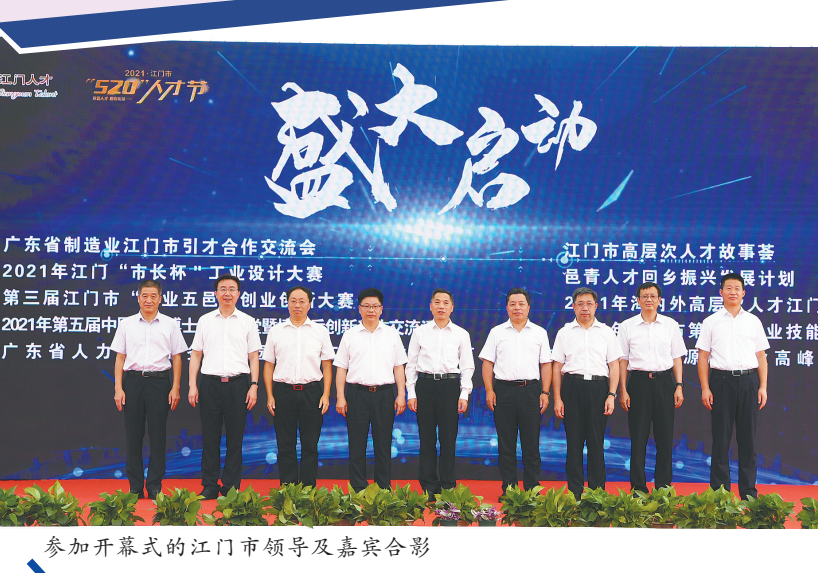
参加开幕式的江门市领导及嘉宾合影

20日下午,2021年江门市首届“520”人才节开幕式在江门人才岛潮头中央公园举行。据了解,持续至22日的“520”人才节以“党管人才 邑彩纷呈”为主题,主要包括打造展示窗口、开展品牌活动、推出“政策干货”、展示人才风采、落地合作成果等,是江门市历年来活动规格最高、形式最多样化、人才覆盖最广的人才盛会。 开幕式上江门市发布了“侨连世界 邑聚英才”的江门市人才工作口号、人才工作标志及人才绿卡,启动了广东省制造业江门市引才合作交流等九大活动。 开幕式上还举行了余艾冰院士团队与江门市科技局的战略合作协议签约仪式,并向中国工程院崔愷院士颁发江门人才岛项目总建筑师聘书。