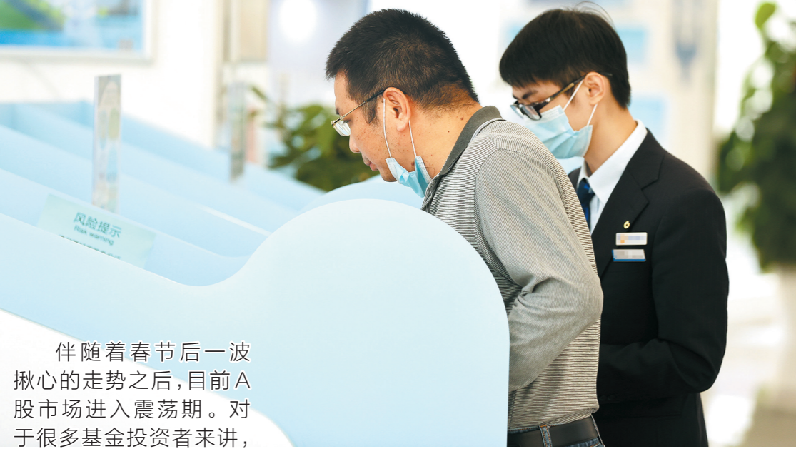
眼下投资市场有所回暖