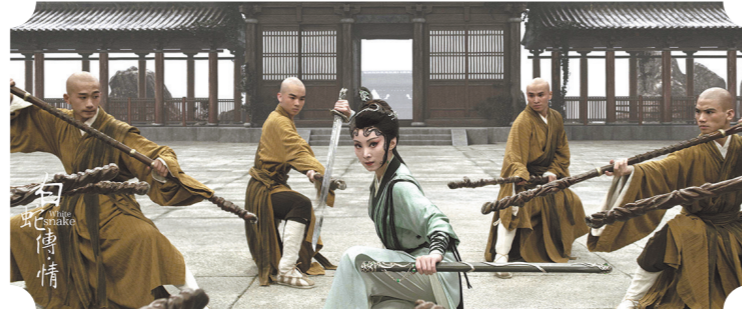
动作戏融合戏曲和电影特色