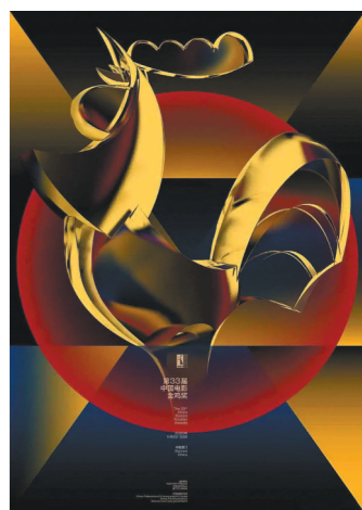
第33届中国电影金鸡奖海报

《光荣与梦想》由刘江执导,赵宇宇编剧。剧集人物角色众多,演员阵容强大。唐国强、侯京健、黄晓明、佟瑞欣、刘劲、张桐、吴刚、马少骅、王劲松、高圆圆、李冉、王丽坤、李晨、倪大红、聂远、李乃文、马元、郑恺、冯雷、高伟光、张一山、关晓彤、曹可凡、郭涛、王晓晨等实力演员加盟,让那些熟悉的人物走出历史书,以鲜活的形象展现在观众面前,塑造出一幅革命群像图。(综合)