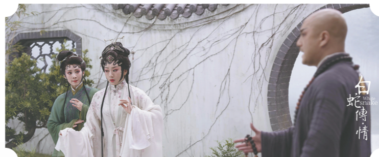
以粤剧形式再现《白蛇传》