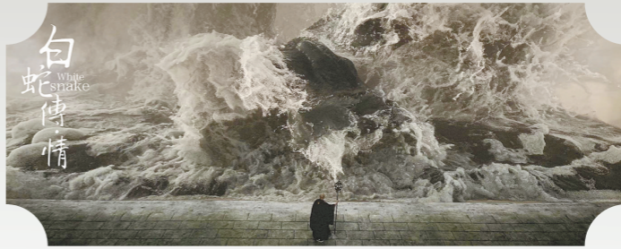
“水漫金山”一幕得到观众认可