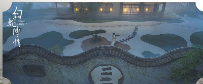
东方美学风格耳目一新