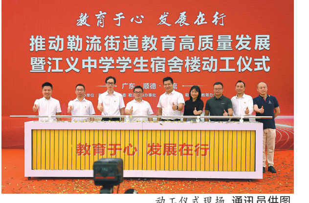
动工仪式现场

并在“十四五”期间总投入20亿元，继续扎实推进教育强基工程，加大奖教奖学力度，营造尊师重教氛围，重振勒流教育强镇品牌。其中约14亿元，将用于启动滨水新城、中部产业园以及富安片区3所新学校建设，力争新建1万个学位，实现全部小规模学校集约办学，为顺德中部崛起提供支撑；同时针对现有全部20所中小学22万平方米校舍进行提升改造，总投入7360万元，彻底消除各项办学隐患。