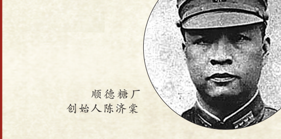
顺德糖厂创始人陈济棠