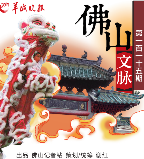
出品 佛山记者站 策划/统筹 谢红