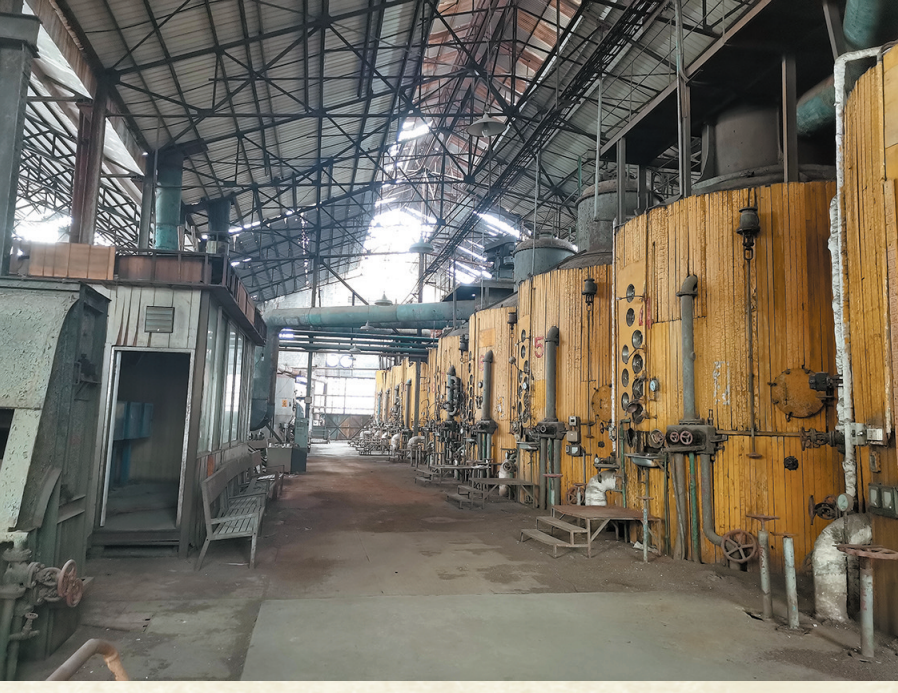
内部设备保存完好

翻开顺德糖厂的历史，从捷克斯可工厂引进全套制糖设备，首创国内亚磷双浮法炼糖工艺，采用国际食糖质量标准组织生产，无不彰显“佛山制造”敢为人先的历史。正是由于其重要的历史价值，2018年1月，顺德糖厂入选了首批中国工业遗产保护名录。