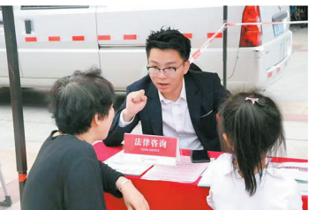
民治居民在家门口可享受免费法律服务

龙华区民治街道“一社区一法律顾问”以1+1模式布局,每个社区配备1名社区法律顾问和1名社区法律顾问助理,社区法律顾问每周固定一天到社区工作站值班,社区法律顾问助理则工作日每天在社区工作站值班。目前,该街道12个下辖社区已实现法律顾问全覆盖,社区居民在家门口就能享受免费法律服务的便利。