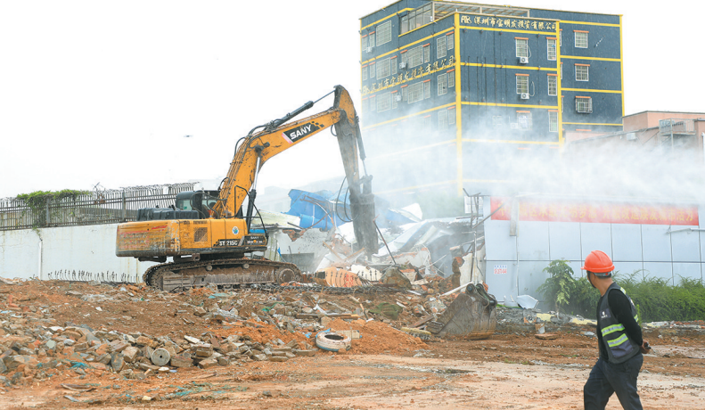
项目共启动13次大型清拆活动

雨无阻、积极上门,探索形成了“四个先行”“一把尺子量到底”等科学机制,促成了大街项目的顺利推进。 截至目前,该项目共启动13次大型清拆活动,累计拆除建筑面积达10.31万平方米,光明大街建设施工全面展开。 为最大程度保留光明人的城市记忆,光明大街施工过程中对于工会片区特有的东南亚建筑风格的骑楼进行部分保留,未来这些独具风格的建筑将会以崭新的姿态出现,成为践行高品质高质量发展理念的典范。 (文/图 于木子 张琦)