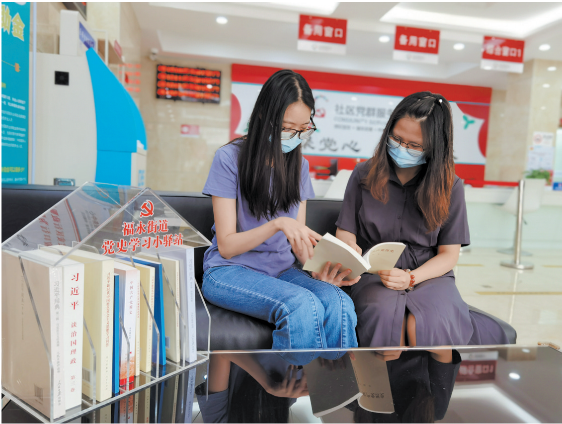
逛街累了,在小驿站翻看党史成为福永市民群众新时尚

近日,宝安区福永街道在辖区设置13个党史学习小驿站,将党史知识送到群众身边,让群众随时随地学习,实现了党史学习教育全覆盖。此外,该街道还依托“百年党史大讲堂”,组建街道、社区两级读书班,推动广大党员、干部、群众学党史、悟思想、深领悟,掀起了党史学习教育热潮。