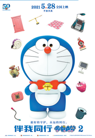
《哆啦A梦：伴我同行2》海报