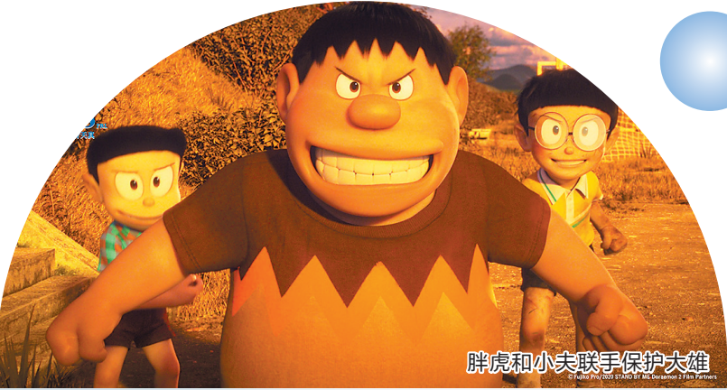
胖虎和小夫联手保护大雄

相比第一部“长大后却失去最爱我的人/机器猫”的催泪主题，《哆啦A梦：伴我同行2》“不必勉强，做自己就好”的主题无疑吞了不少，在口碑传播中也缺乏怀旧效应。此外，该续集于去年在日本本土上映后口碑出色，也容易让中国观众对其产生过高的期待。影片在中国内地上映前，豆瓣评分高达8.4分，上映首周末结束后却掉至7.4分，足见该片确实出现了高期待下的口碑落差。尽管有不少观众认为《哆啦A梦：伴我同行2》细节更多、更耐看，但也有观众认为续集“乏善可陈”“情感浓度太淡”。此外，有观众认为大雄在这一部中更多地展现了“自我接受”而非“努力进取”，因此缺乏成长性。有人吐槽：“真不明白静香看上他啥了。”