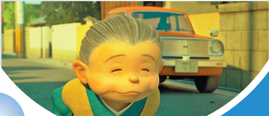
可爱的奶奶成为片中最大泪点