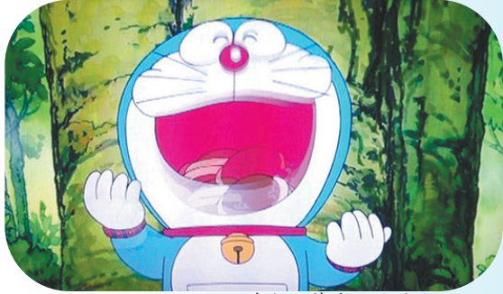
哆啦A梦出现十个指头

不过，《哆啦A梦》动画中的确偶见哆啦A梦露出手指的画面。比如在《命令枪》这一集里，哆啦A梦掏出枪型道具，其小圆手突然出现两根手指。手指虽短，但足以让他扣动扳机。