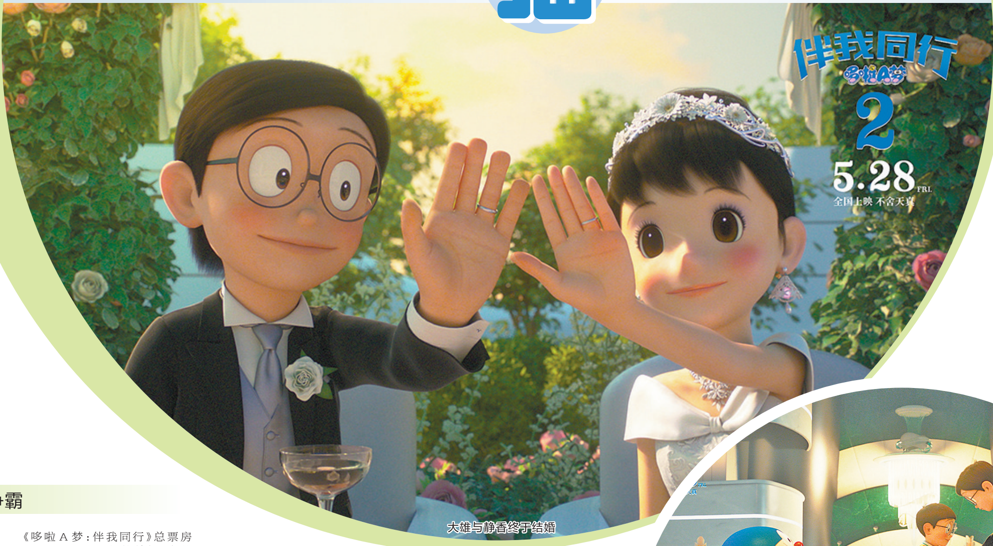
大雄与静香终于结婚