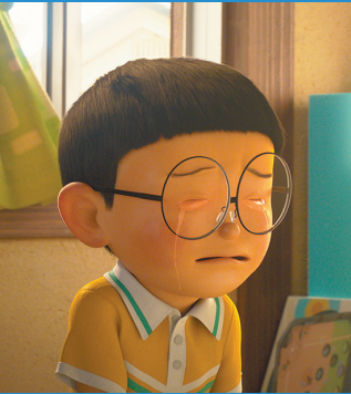
大雄还是个爱哭包