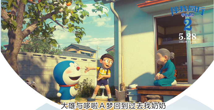
大雄与哆啦A梦回到过去找奶奶