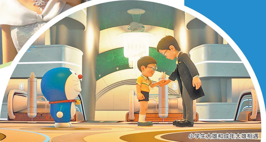
小学生大雄和成年大雄相遇