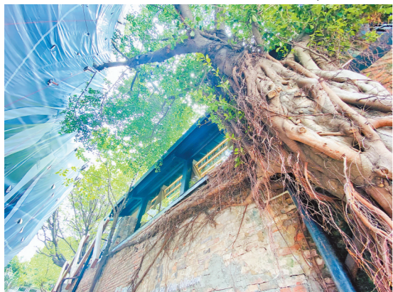
斑驳的老墙与苍老的榕树融为一体