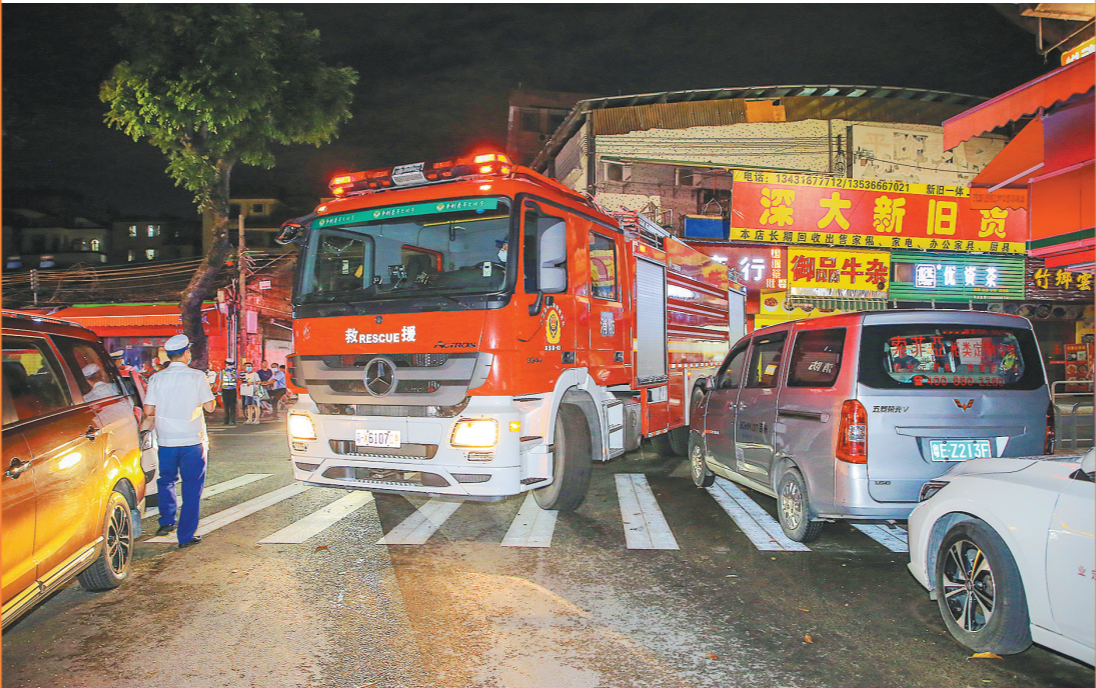
消防车到了现场,“卡”在了满是违停车辆的通道上

羊城晚报讯 记者张闻、通讯员禅公宣摄影报道: “深村大道靠近岭南大道路口违停严重,如果发生火灾,消防车肯定过不去。”近日,一段举报视频出现在禅城公安后台留言当中,只见画面中一条双向通行的道路两边停满了车辆,只留下中间约一合车宽度的通行空间,场面十分混乱。