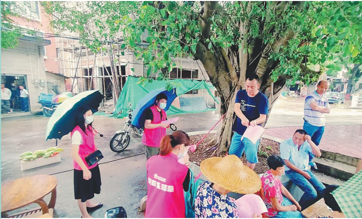
下雨天宣传疫情防控举措

羊城晚报讯 记者欧阳志强、通讯员龙宣摄影报道: 端午期间,是打好疫情防控硬仗的决战期、做好安全防护工作的关键期,佛山市顺德区众多党群志愿者放弃休假,下沉一线,挨家挨户做好防疫知识宣传,指导督促落实防疫措施,织牢织密联防联控“防疫网”,保障人民群众平安祥和过节。