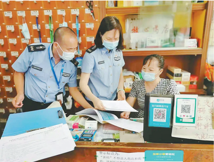
执法人员在对零售药店、凉茶铺开展检查

羊城晚报讯 记者曹月报道: 端午佳节期间,为确保广大群众度过一个安全、祥和的节日,切实维护消费者的合法权益,佛山市顺德区市场监督管理局局长劳广行和多位局领导带队,兵分多路对农贸市场、药店、密闭场所、餐饮服务单位等场所进行了检查。