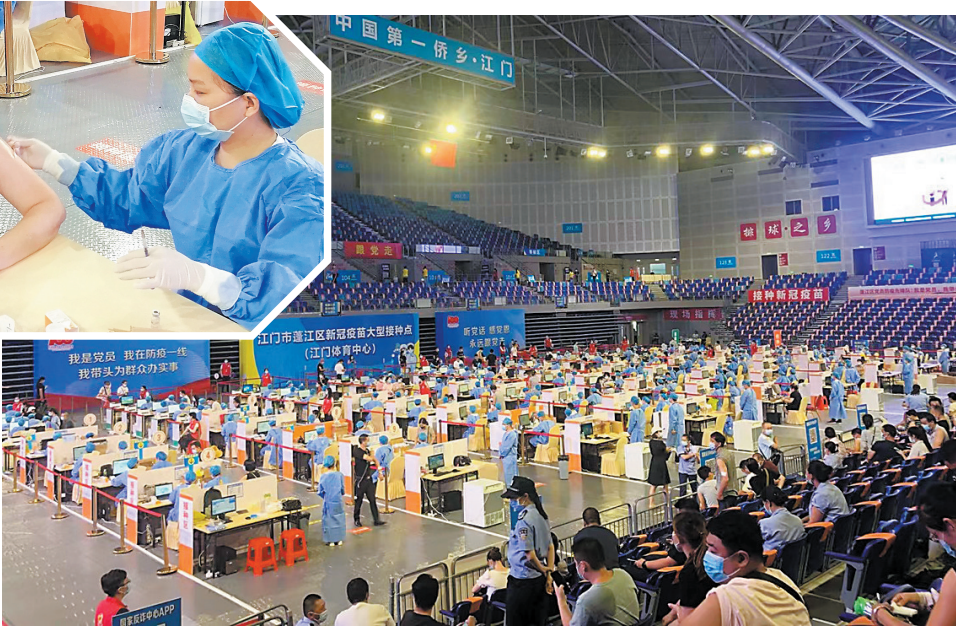
▶ 江门体育中心体育馆内的临时接种点假期不停摆

午2时到晚上9时，持续为广大市民提供优质的疫苗接种服务。目前，按照调配的剂量，每天约为1000人次接种。”