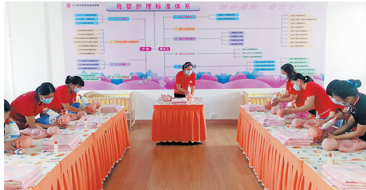
家政专业成为江门首批试点申报乡村工匠专业类人才职称的行业之一

记者了解到，针对选定的8个专业，结合江门市产业发展情况和乡村工匠人才工作实际，江门市又进一步细化了省评价标准，对产品数量、种植亩数、养殖数量、销售额等具体量化，解决实操性和公平性。此外，江门市农村实用人才评价也有效衔接贯通到乡村工匠评价体系，将南粤家政、粤菜师傅评价纳入乡村工匠评价范围，增加破格条件的奖项设置，体现以实际成效为导向的评价机制。