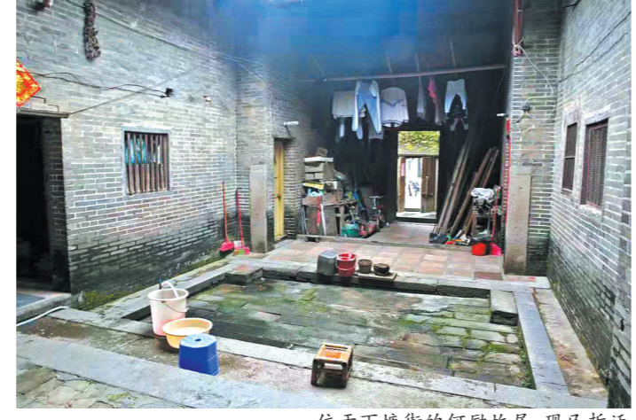
位于下塘街何励故居，现已拆迁

何励，原名何丽琴，1921年10月出生于惠州市惠城区下塘街，在家族同辈女丁中排行第七，家族中称之为“七姑娘”。她早年投身革命，是东江抗日先烈彭泰农遗孀。在彭泰农壮烈牺牲后，她临危托孤，投笔从戎，是东江纵队唯一手持双枪的英雄女战士，在长期的革命斗争中，立下卓越功勋。