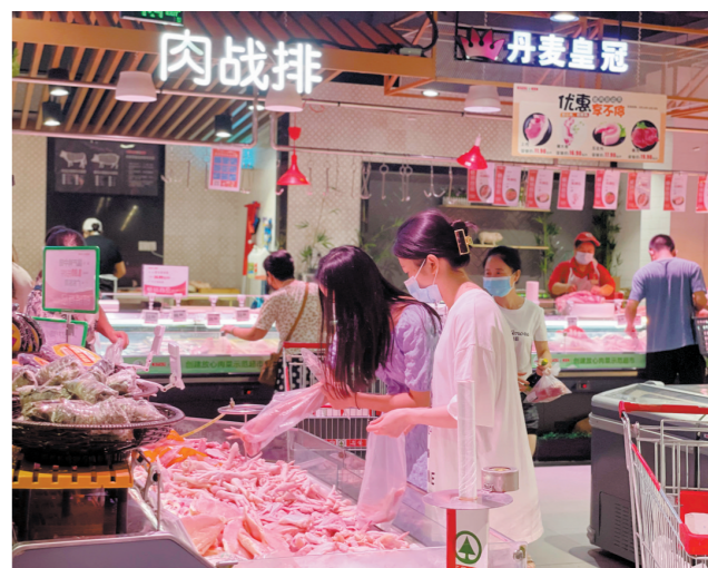
嘉荣SPAR全力保障民生物资货足价稳

日前,东莞出现本土新冠肺炎确诊病例,疫情引发关注。为尽快控制疫情,东莞各地各部门迅速响应打响疫情阻击战,对部分重点区域实行封闭封控管理。嘉荣SPAR作为民生超市,积极响应当地政府工作安排,全面部署、迅速行动,全力保障封闭区域及周边居民生活物资供应,以实际行动传递“嘉荣温度”。