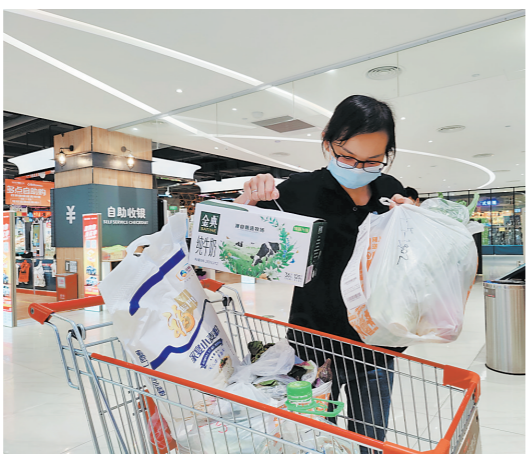
嘉荣员工加班加点供应物资