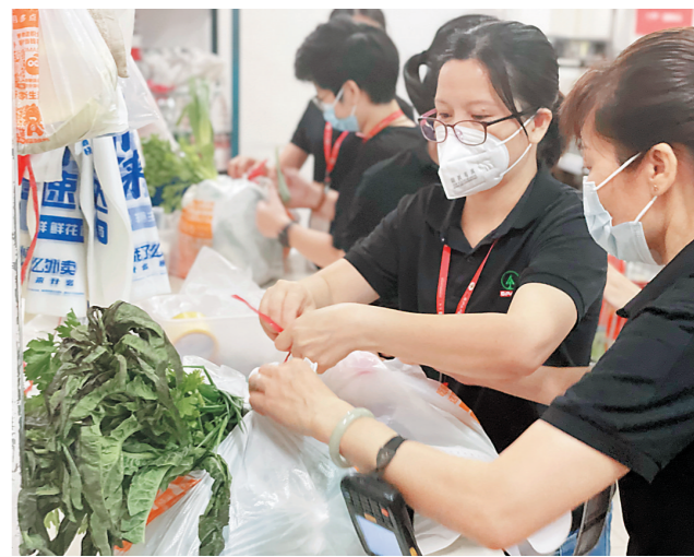
保障市民“菜篮子”充足

运力,确保当日下单当日送达;门店人员每日连续上岗15多个小时,保障市民“菜篮子”“米袋子”充足;总部各部门人员紧急驰援疫情封控区周边门店,积极加入保供行动中……在嘉荣旗下的每一家门店及嘉速物流配送中心,都有很多令人感动的场景,展现了非常时期勇于担当的“嘉荣精神”。 “在‘战疫’的特殊时期,作为本土大型零售企业,嘉荣积极践行作为民生企业的社会责任,助力打赢疫情阻击战,全力保障百姓的平价生活物资供应。”嘉荣SPAR超市相关负责人表示,随着疫情得到进一步控制,接下来嘉荣SPAR还将继续发挥“菜篮子”的保供作用,让更多居民能够方便、快捷地购买到新鲜的水果、蔬菜、肉禽蛋以及米面粮油等生活物资,力保居民生活需求得到满足。