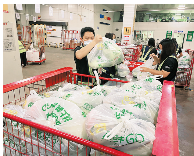
全力调配备战人员及物资,全面保障供应