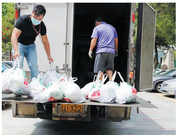
嘉荣员工坚守防疫一线保障物资配送