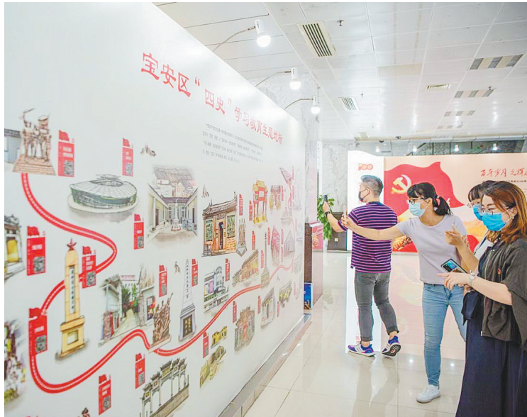
新安党员干部群众观看图片展