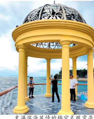
充满滨海风情的镂空式观赏亭

视野开阔的海滨步道;极具滨海特色的中海海枣树随风摇曳;充满滨海风情的镂空式观赏亭可拍无敌海景。近日,市民发现大鹏新区南澳海路人行道蜕变成一处极好的滨海风情打卡地。