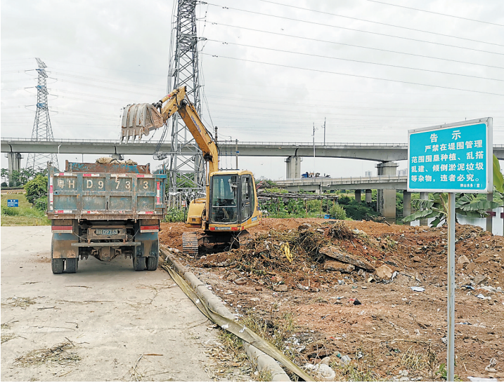
西南涌旁，工作人员正在使用钩机清理垃圾