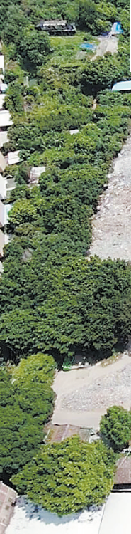
▲稔岗南望工业区改造项目是一个拆除旧厂房改造为生态公园的“工改公益”项目