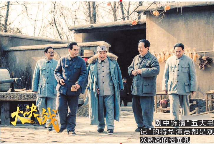
剧中饰演“五大书记”的特型演员都是观众熟悉的老面孔