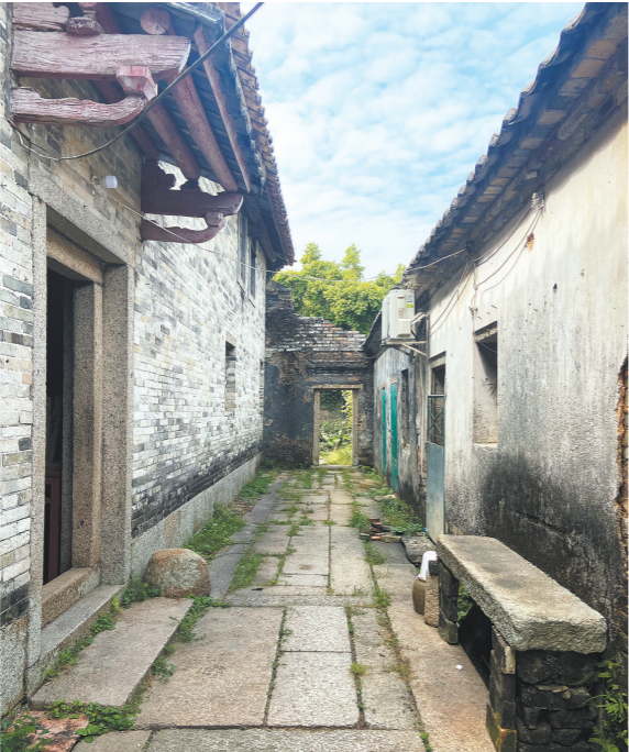
祖屋内巷道四通八达

平海曾氏除了曾守约外,又有族裔曾必元于清乾隆四十二年(1777年)乡试中举。曾必元8岁能文,10岁能诗,有“神童”之誉。他中举后却无心仕途,转身下海从商,致富后不忘反哺教育,造福桑梓。他曾出资扩