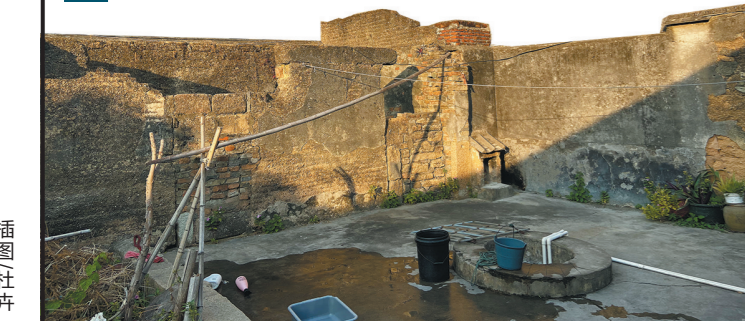
后院的水井至今有人使用