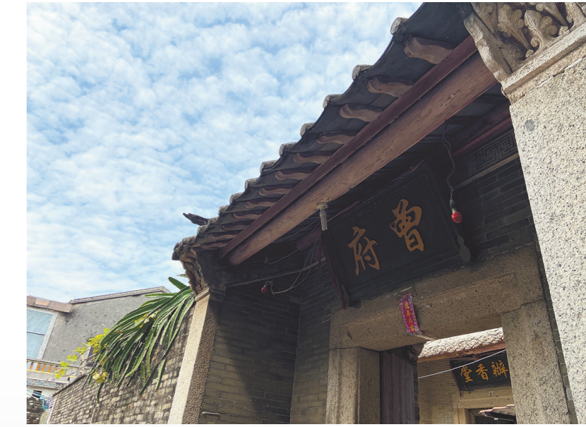
曾府大门依旧气派

稔山长排陈氏家族以耙盐为主业,富甲一方,持家勤俭的作风始终不变,“衣服布素,饮食省约”“所业为读书、耙盐两途:读书