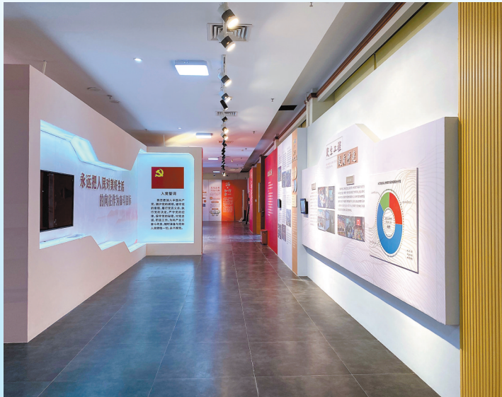
大沥镇新时代文明实践所新所启用

羊城晚报讯 记者张闻、通讯员邓倩茹摄影报道：大沥镇新时代文明实践所新所13日在广东书法园启用，大沥镇新时代文明实践所、广东书法园、文明实践宣讲三大板块，将打造集理论宣讲、爱国教育、志愿服务、传统文化、文明培育、休闲娱乐于一体的多功能宣传服务平台。