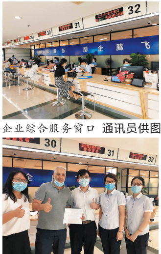
企业综合服务窗口

为推进政务服务从网上、掌上“可办”向“好办、易办”转变，针对商事登记领域事项类别多、法律法规多、群众咨询多的现状，顺德在区级行政服务中心组建“企业办事帮办专区”，通过保姆式审批帮办服务，为企业排忧解难。帮办人员根据企业需求，制定个性化的材料套餐及最省时省力的办事流程，做到“想企业之所想，急企业之所急”。同时，发挥联