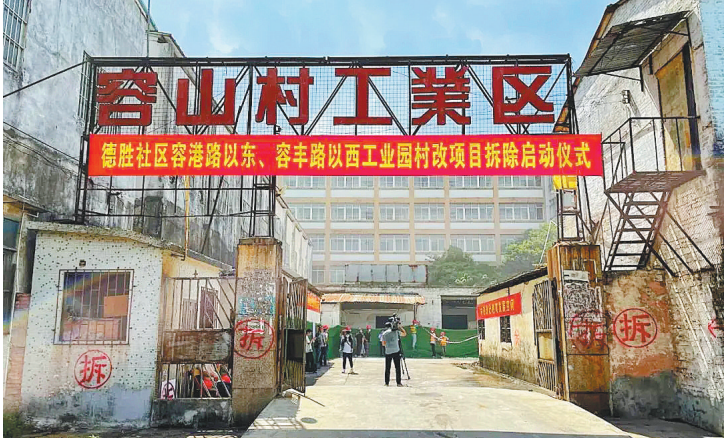
容桂街道启动对德胜社区容港路以东、容丰路以西工业园改造项目的拆除工作

值得一提的是，作为实践所的重要学习教育平台之一，大沥镇新时代文明实践所、广东书法园线上数字展览云平台也在13日正式上线。后者是中国首个镇街艺术云展馆，将打造成数字成果展示窗口和数字体验基地，汇聚展示大沥的文化成就，提升扩大文化大沥的品牌影响力，增强美育普及。