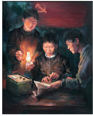
《西泉公书院的灯光》油画 林梓琪 画