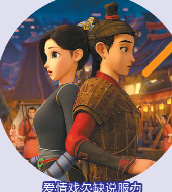
爱情戏欠缺说服力

从剧情的篇幅分配来看,《俑之城》的剧情重点在两个方面:一是战争戏,二是爱情戏。在战争戏方面,俑之城展现了人俑之间、人俑与“地吼”之间、人俑与青铜兽之间各种规模的打斗,展现了该片在制作上的水准与良心。但很可惜,这方面戏份虽能展现展现技术,对剧情的推动作用却不大。相比之下,爱情戏显然能在展现人物的成长轨迹上起到更大作用。可惜的是,《俑之城》的爱情戏套路满满。男女主人公除了共同经历了几次出生入死,并无更深层次的精神交流。人设冷酷成熟的女主为何爱上个性轻佻浅薄的男主,似乎不是一句简单的“日久生情”就能轻易解释的。缺乏足够情感基础的情况下,影片却频频用深情插曲来为两人的恋爱戏“推波助澜”,只会令观众更觉尴尬。