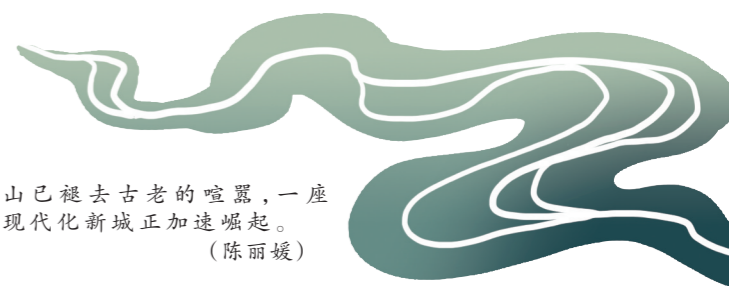
山已褪去古老的喧嚣，一座现代化新城正加速崛起。(陈丽媛)