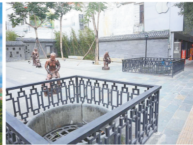
街尾井街心公园于2018年建成，两口古井得到妥善围护