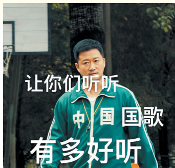
网友制作的吴京表情包