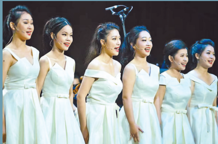
星海音乐学院民族声乐系南方女子合唱团

示:“文艺要多出高峰作品,先决条件是把‘高原’打扎实。我们做的很多事,都是尽量把高原打扎实,为高峰作品的出现打好基础。”值得一提的是,组歌中的部分歌曲《追梦万里》《渔村水路连水乡》《红》进入了中国音协主办的中国当代歌曲创作精品工程“听见中国听见你”全国前60强,并获得“听见中国听见你”华南区优秀作品称号。