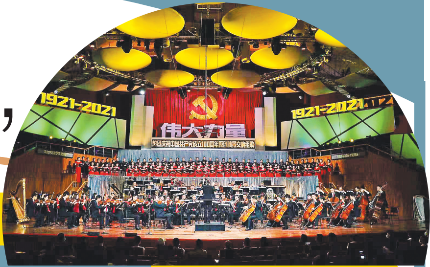
“伟大力量”成功首演