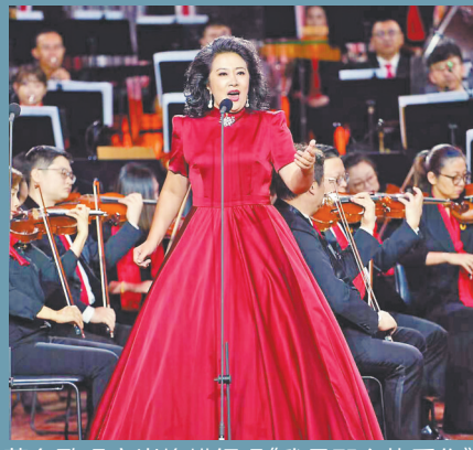
著名歌唱家崔峥嵘领唱《我是那么热爱你》