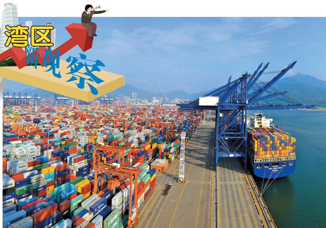
盐田港吞吐量保持较快增速

具体来说，福田区将从湾区、市域、区内等辐射范围加强综合交通体系建设，在加快完善设施网络、聚焦提升出行体验、