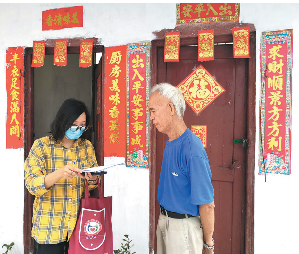
群众在“办实事”实践中得到实惠

今年初，江门在全省范围内率先谋划推进“百件实事庆建党百年——我为群众办实事实践活动”，目前已取得阶段性成果。截至目前，市县两级收集的民生实事目前已办理2004项，完成率77.95%，五大领域100项民生实事按节点进度已完成62项。下半年，江门市还分批推出“民生微实事”1346件，确保11月办结。