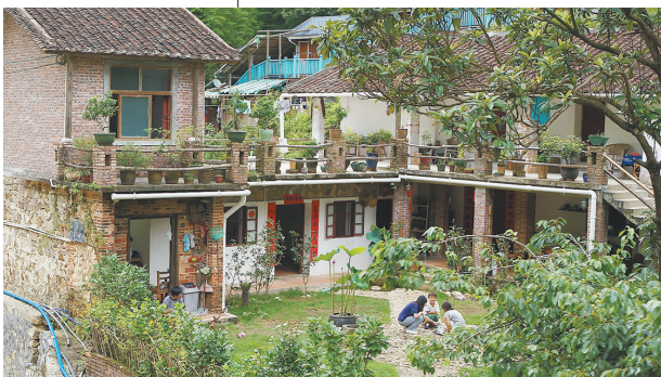
南昆山吸引不少游客专程体验“民宿游”