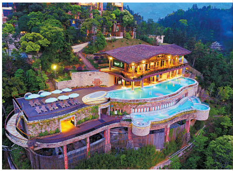
十字水生态度假村泳池温泉,吸引无数游客打卡

事实上,南昆山民宿也是惠州民宿产业发展的缩影。作为广东文化和旅游大市,惠州山水旅游资源丰富,民俗风情各异,具备发展民宿的“天然优势”。截至2020年11月底,惠州民宿客栈达1052家。日前,记者从惠州市文化广电旅游体育局获悉,《惠州市民宿管理实施细则》拟于年内出台,将进一步推动全市民宿产业健康可持续发展,“民宿大市”的打造指日可待。