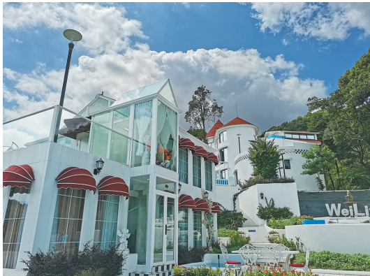
“网红打卡地”云侣堡

盛夏酷暑,“避暑胜地”南昆山生态旅游区几乎“一房难求”。小民宿,大产业!近日,记者实地走访发现,南昆山民宿遍地开花,聚集超过260家,“民宿生态园”初具雏形。精品民宿备受青睐,成为“网红打卡点”,不少游客专程前来体验“民宿游”,成为景区中一道靓丽风景线。