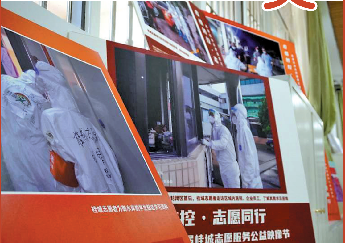
本次公益映像节向市民展示了疫情防控期间的不少暖心故事

羊城晚报记者黄磊、通讯员郭嘉欣摄影报道：8月7日，首届桂城志愿服务公益映像节在桂城街道新时代文明实践所举办，映像节上展出的摄影、视频、绘画等作品记录了2021年桂城志愿者们参与疫情防控的真实瞬间。