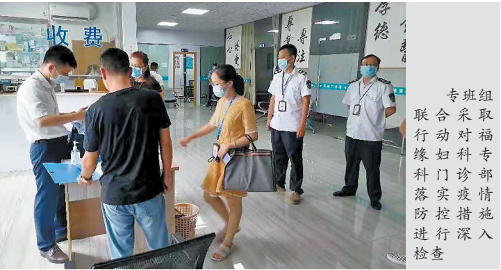
专班联合采取行动对福缘妇科专科医院门诊部落实疫情防控措施进行深入检查

南海区卫健局再次提醒：当前新冠肺炎疫情防控形势复杂，社会办医疗机构要主动融入疫情防控大局，坚持和公立医院一样严格的防控标准，牢记“三不得十必须”，时刻绷紧疫情防控这根线，积极查漏补缺，严防死守，共同筑牢疫情防控安全防线。