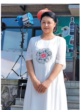
除了《乡村爱情》,于月仙曾出演过多部影视剧

对于于月仙突然去世的消息,众人震惊不已,相关话题瞬间登上微博热搜榜榜首。于月仙、小沈阳、孙茜、姜超、辛芷蕾、王小利、郭冬临等演员发文悼念。与于月仙有过多次合作的沈腾发微博道:“真是不敢相信,小姨一路走好。”网友也纷纷表示无法接受:“大脚超市永远没有大脚了,一路走好。”“每年都会追的剧,真不敢相信,再也看不到大脚了。”“永远不知道明天和意外哪个先来,珍惜眼前人。”