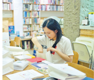
新娘一苇在亲自包装抽奖书籍