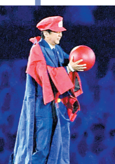
安倍晋三化身游戏人物