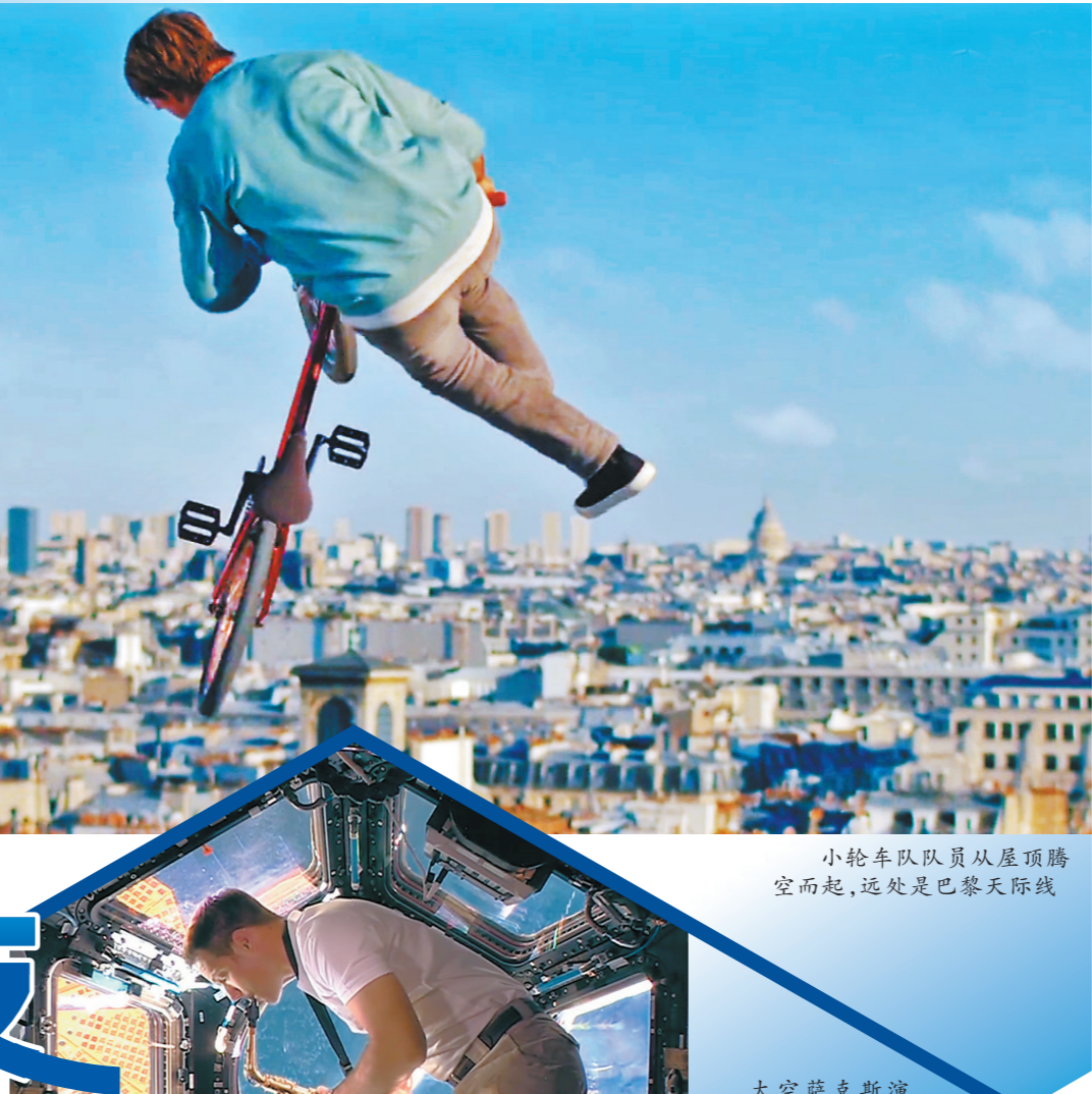
小轮车运动员从屋顶腾空而起，远处是巴黎天际线