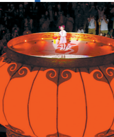
大红灯笼为舞台，女孩演唱《茉莉花》

“北京八分钟”可谓集中中华文化之大成。第一段，带来民族特色的歌舞表演，14名中国女孩拿着琵琶、二胡、手鼓等乐器演奏《茉莉花》；第二段，穿着民族服装的武术