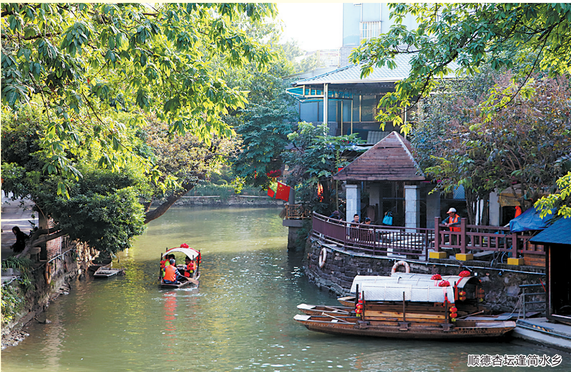
顺德杏坛逢简水乡

羊城晚报讯 记者景瑾瑾摄影报道:8月10日,广东省文化和旅游厅发布了关于“广东省民间文化艺术之乡”候选名单的公示。根据公示名单,佛山的石湾(南艺)、西樵(醒狮)、杏坛(水乡民俗)、九江(龙舟)入选。