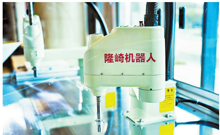
顺德本土企业与日本川崎机器人合资成立的顺德隆崎机器人(资料图片)

此外,《方案》还提出,将支持龙头企业实施并购重组、强强联合,加快形成引领产业发展的领军企业。大力培育“专精特新”企业,打造一批细分行业的单项冠军和“小巨人”企业。培育引导成长性好的小微企业升规模以上企业,进行“企业固链”。