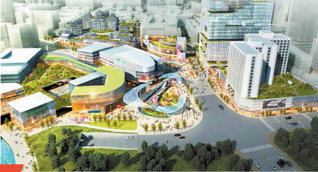
东门商圈改造效果图

正式提上议程。去年初，坐落在东门商业圈旁的深圳市工人文化宫向全球征集改造设计方案。始建于1953年的文化宫，承载了许多深圳职工的欢乐和回忆，但也面临着建筑质量差、服务场所不够、功能设施老化等问题。根据改造方案，未来，文化宫将被改造为亲水文化休闲空间，文化艺术碰撞舞台，拥