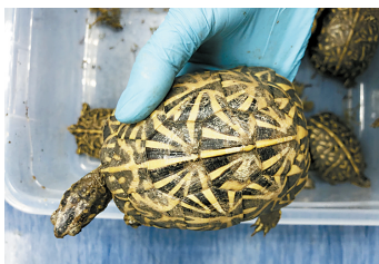
海关查获的濒危物种龟

鉴定结果显示，该批动物中包含被列入《濒危野生动植物种国际贸易公约》(CITES) (2019) 附录Ⅱ，其野外种群为国家二级保护野生动物的黄喉拟水龟25只、安布闭壳龟28只以及卡罗莱纳箱龟8只；被列入《濒危野生动植物种国际贸易公约》(CITES) (2019) 附录Ⅲ（中国），其野外种群为国家二级保护野生动物的花龟1只；被列入《濒危野生动植物种国际贸易公约》(CITES)