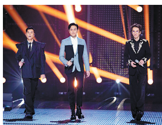
梁汉文、张智霖、林志炫（左起）