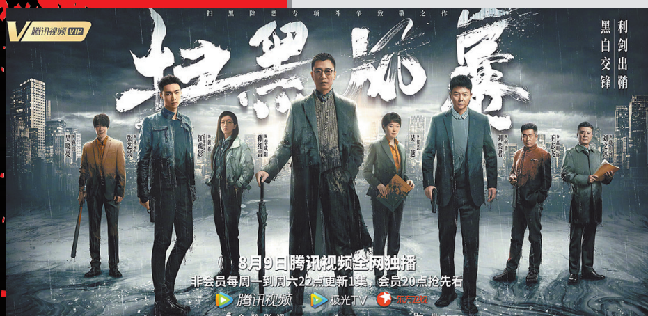
《扫黑风暴》口碑不俗