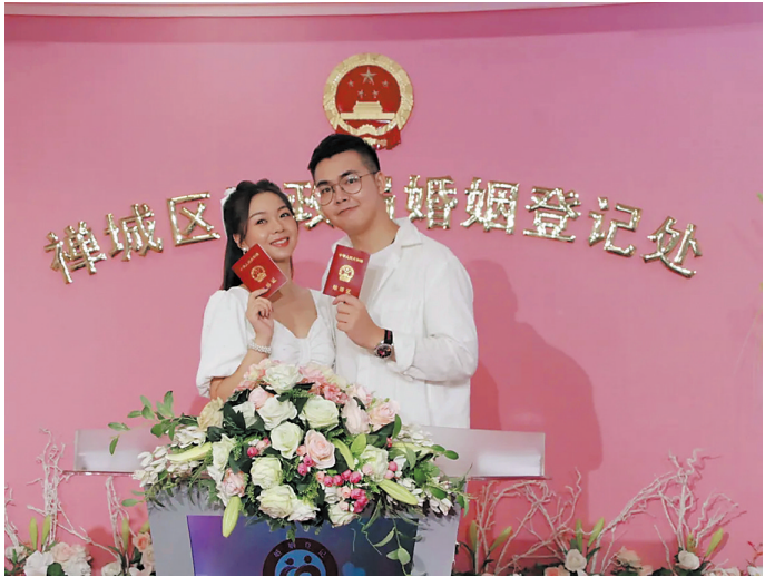
新人甜蜜合影

为了让新人们都能在这个特别的日子里完成登记,佛山市各区分民政局婚姻登记处从延长办公时间、优化婚姻登记流程、增加工作人员等多方面出发,在做好疫情防控的条件下确保婚姻登记工作有序进行。