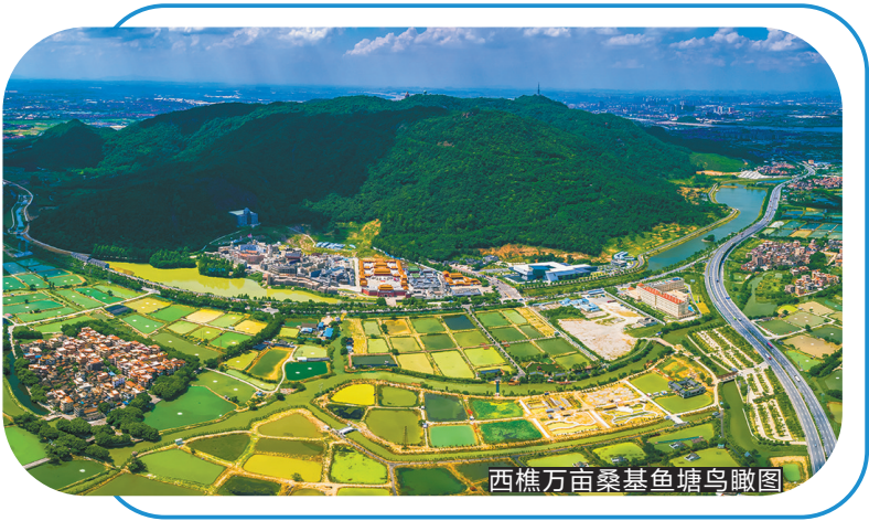
西樵万亩桑基鱼塘鸟瞰图

退动力机制,对生态用地修复给予用地指标奖励。近三年复垦复绿超5500亩,新增绿化面积2.4万亩,进一步推动了生态空间重构。同时,城乡基本公共服