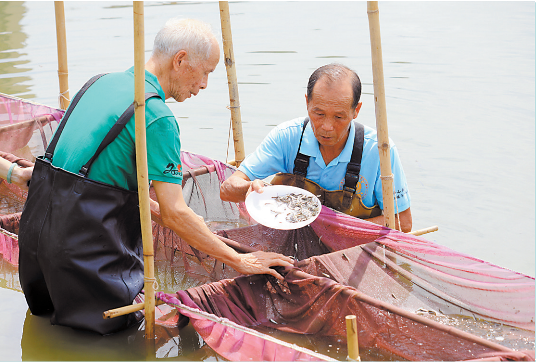
市级「非遗」项目「数鱼花」