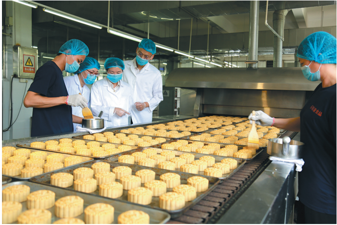
海关工作人员对出口月饼进行监管

据了解,针对月饼应节性强、保质期短等特点,佛山海关通过预约申报、预约检验、优先安排下厂施检等措施缩短检验时间,有效提升通关效率。截至8月11日,仅顺德办事处监管出口月饼共11.4吨,22344盒,货值约85万元人民币。