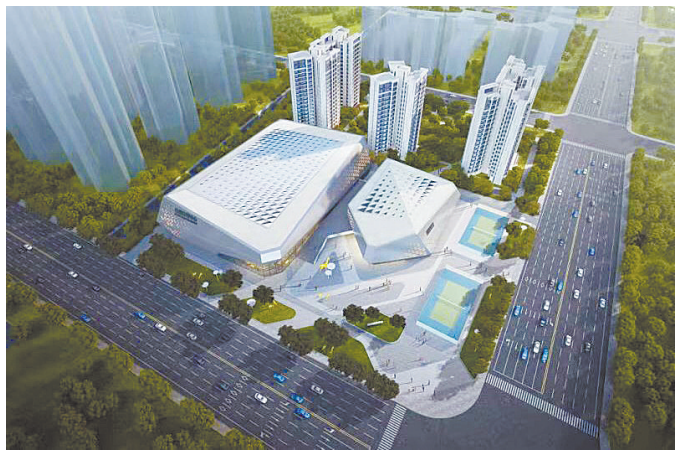
体育馆鸟瞰效果图