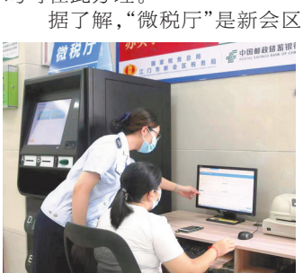
派驻“微税厅”的税务人员指导市民报税

羊城晚报讯 记者陈卓栋,通讯员林玉欢、梁凌致、谭耀广摄影报道:记者17日从江门新会区税务局获悉,近日中国邮政储蓄银行首个“微税厅”在江门市新会区支行营业厅正式上线。这是江门市首家由税务系统与银行联合推出的“微税厅”,新会区税务局超九成税费业务均可在此办理。