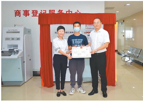
广东明鼎科技有限公司现场领取了首张智慧柜员机智能办理的营业执照

羊城晚报讯 记者陈卓栋,通讯员陈敏锐、陈蔓鑫、谭耀广摄影报道:记者17日从江门市市场监督管理局获悉,江门市市场监督管理局与中国工商银行江门分行联合推出智慧柜员机全程智能办照服务,并于日前举行上线仪式。此举也意味着江门市“商事登记+智能审批”服务得到进一步推广应用,实现三个“全覆盖”。 据介绍,此次服务上线后,江门市实现了“商事登记+智能审批”服务实现业务办理类型全覆盖、线上办理渠道全覆盖以及全市区域办照全覆盖。记者了解到,通过智慧柜员机全程智能