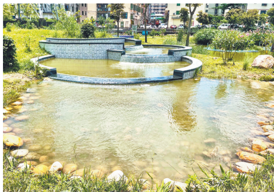
新青正涌公园

绿树红花、小河流水、亲水步道、廊桥亭阁等这些靓丽的景观,如今,去到珠海市斗门区井岸镇新青正涌和五福涌也能找到。笔者了解到,昔日备受诟病的新青正涌、五福涌已华丽变身,通过雨污分流建设工程、水循环工程、环境整治工程等一系列整治成为了两座水清岸绿、景色宜人的湿地休闲公园,为周边居民打造全新“亲水绿廊”。