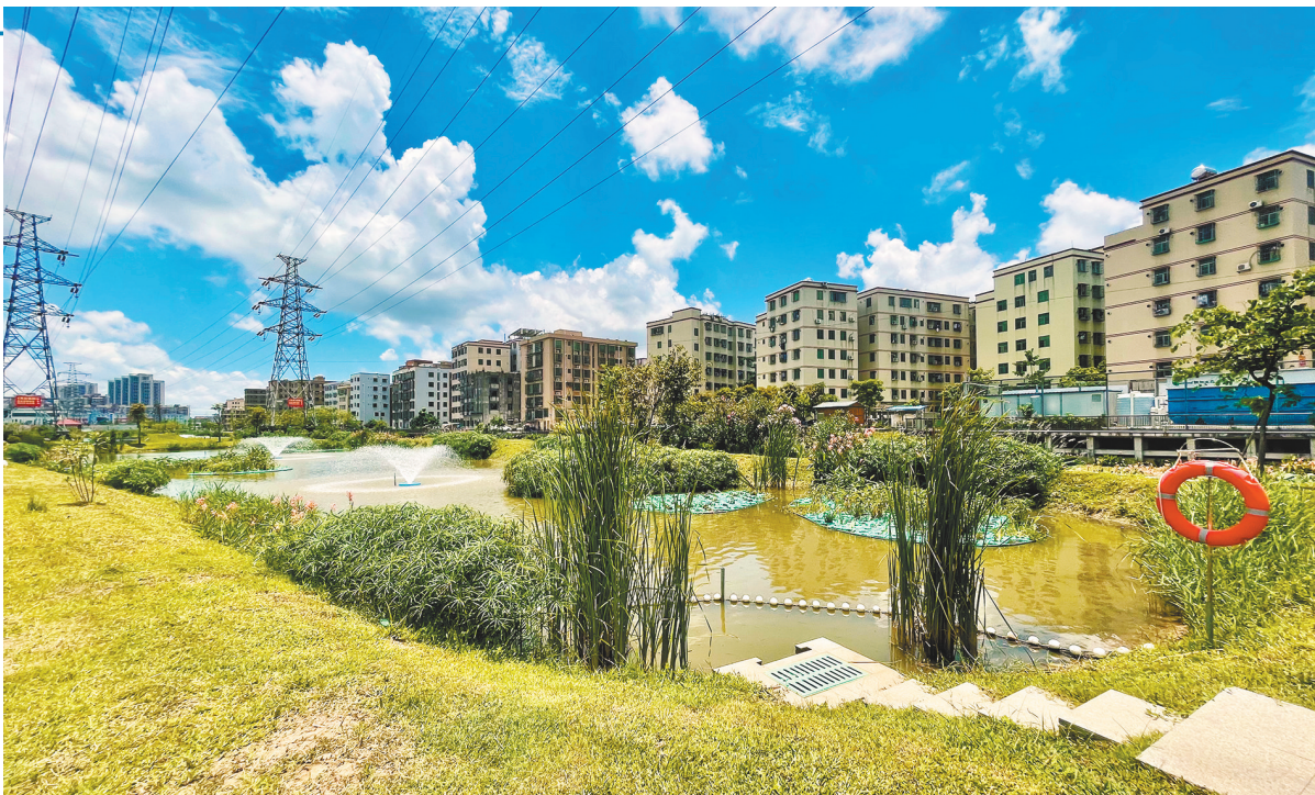
昔日的黑臭河涌已变“亲水绿廊”

笔者近日来到新青正涌公园看到,河涌水质清澈,岸上景色秀美,如画般景观吸引了不少街坊,成了他们休憩玩耍的新去处。新青村村民罗姨说:“以前河涌又臭,环境又乱,垃圾又多,现在干净很多,水也干净了,公园建得很漂亮,晚上吃完饭经常过来散步,很舒服。”