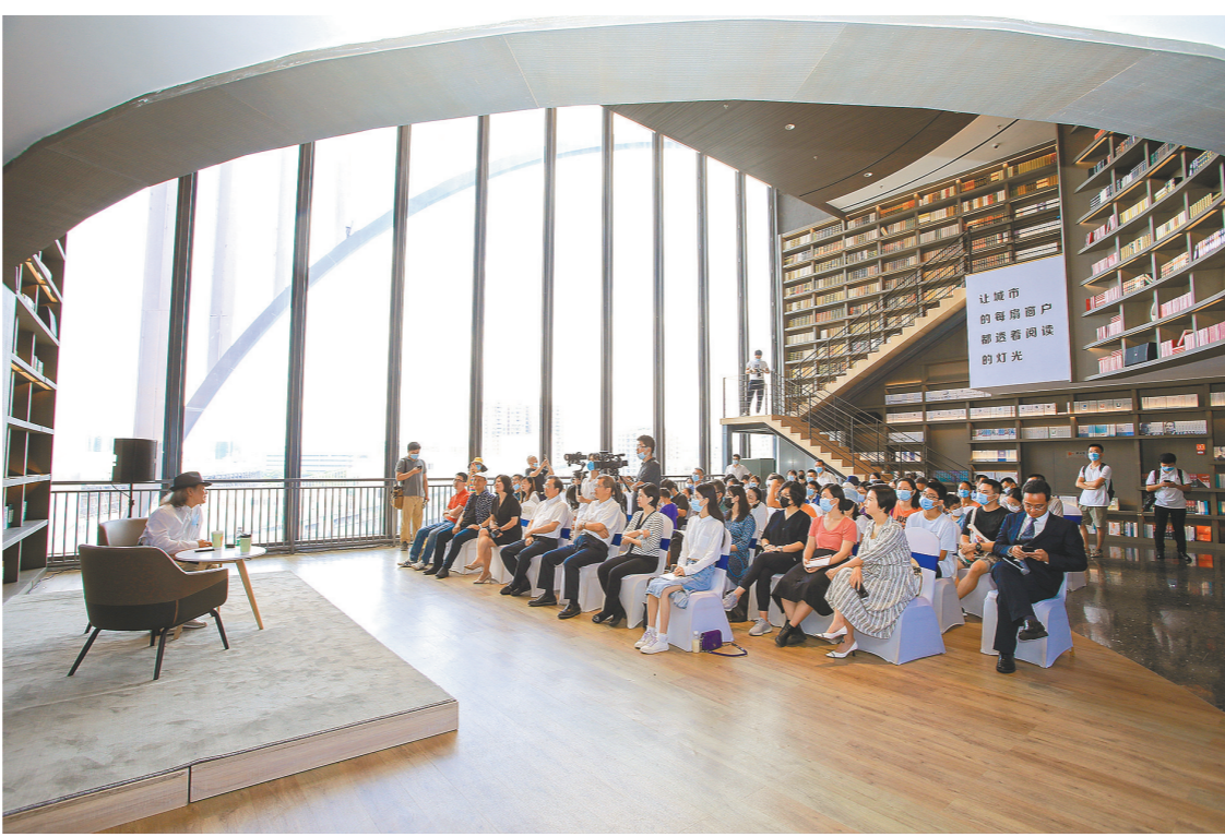
漫画大师蔡志忠龙华开讲

8月25日,蔡志忠美术馆落户龙华签约仪式暨“传统文化与国学思想”专题讲座在深圳市书城龙华城举行。蔡志忠的漫画以中国传统文化为题材,从诸子百家到四书五经,从唐诗宋词到民间传说,将经典加以现代诠释并通过漫画形式展现。