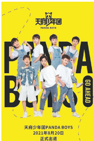
“天府少年团”昙花一现

“天府少年团PANDABOYS”于今年8月20日在成都发布单曲宣布出道,组合由7名男孩组成,最小的7岁,最大的11岁。不少网友对未成年人在娱乐圈出道表示不解:“这不是养成系,是育儿系吧?”“8岁的孩子,让他们好好上学吧”。 8月21日,天府少年团所在公司回应质疑,表示天府少年团的经纪团队是“少儿教育探索者”,公司不是把孩子当做赚钱工具,而是在孵化具有时代意义的新一代少年榜样。 24日凌晨,该公司宣布天府少年团更名“熊猫少儿艺术团”,并表示公司“不做饭圈文化,没有资本运作”。24日,公司宣布天府少年团解散。