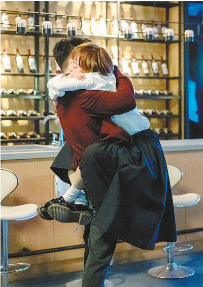
苏筱(孙俪饰)醉后扑到夏明怀里