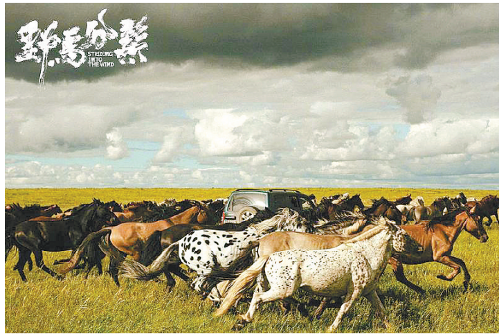
《野马分鬃》业内口碑不错

电影《野马分鬃》近日宣布延期上映,新档期择日公布。此前,影片定于9月3日公映。 片方发布公告称:“原定9月3日上映的《野马分鬃》,经各方协商后决定延缓上映。新的档期择日公布。感谢各位对《野马分鬃》的支持,路遥方知马力,我们择日