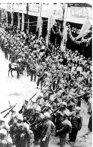
1949年10月15日解放军进城，水东街商民欢迎盛况。