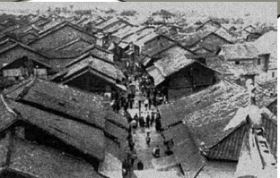
1928年尚未改造扩宽的水东街。

水东街位于惠州桥东，东西走向，东接惠新西街，西连东新桥头，全长730米。自南汉以来，水东街之地已被视为“逆水福地”，入明后成为东江商业重镇，清代进入鼎盛期，后历经炮火轰炸衰落又重生。经过十年改造，如今的水东街焕发新活力，成为惠州文旅新地标，吸引众多市民游客前往打卡。