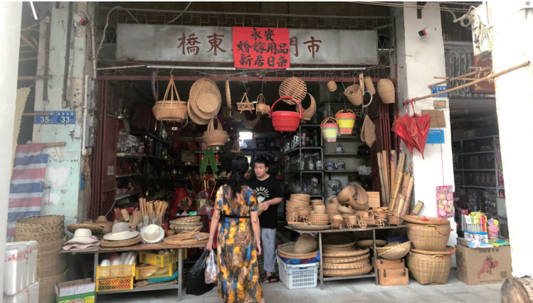
水东街充满各式的老店铺

有鉴于此，惠州市政府从2006年开始着手拟订水东街改造重建规划，于2009年9月，一期改造水东西路动工，一栋栋骑楼老房子纷纷倒下，新建筑“仿古重建”。在反对声中，加之资金问题，项目改造于2012年底停工，直到一年后才开始复