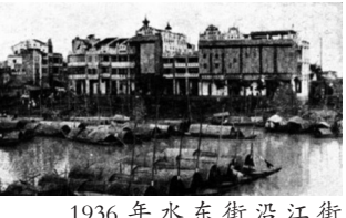
1936年水东街沿江街景。