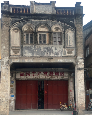
水东街不少房屋仍基本保持着一楼一顶的临街骑楼构造、西式风格的屋顶壁面

水东街重返昔日繁华，仍任重道远。好消息是，在惠州“十四五”规划中，水东街等省级历史街区的保护利用被多次提及。根据规划，接下来惠州要厚植文化内涵、丰富体验业态，以“绣花”功夫改造提升水东街。同时，以环西湖文化圈提升、千年惠州文脉内核挖掘为重点，整体规划推进环西湖城市中央休闲文化区与水东街、金带街等省级历史文化街区保护利用，使其成为惠州提升城市现代化水平、建设文化强市的重要一环。