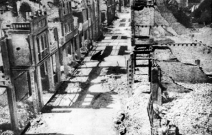
1941年5月被日军焚毁的水东街。