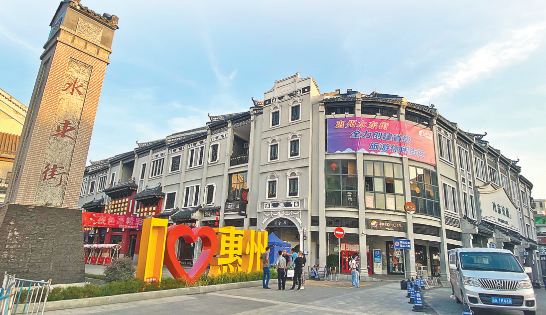
经过改造后的水东街，成为惠州文旅新地标

水东街为何能够成为盛极一时的商业旺地？数百年商埠文化是如何形成？又发生了哪些鲜为人知的事迹？本期起，羊城晚报《惠州文脉》将追溯